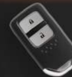
SMART KEY + KEYLESS ENTRY (RS)