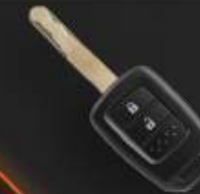
WAVE KEY + KEYLESS ENTRY