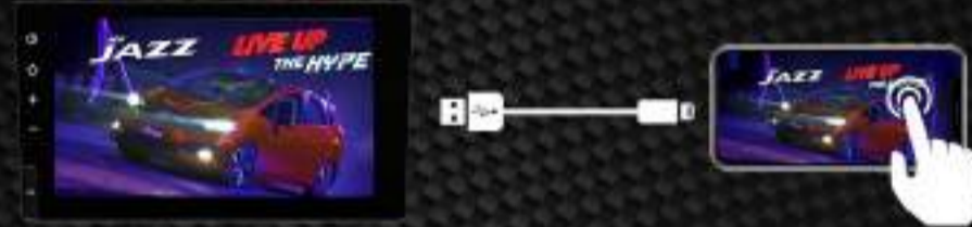
One-way mirroring for iPhone