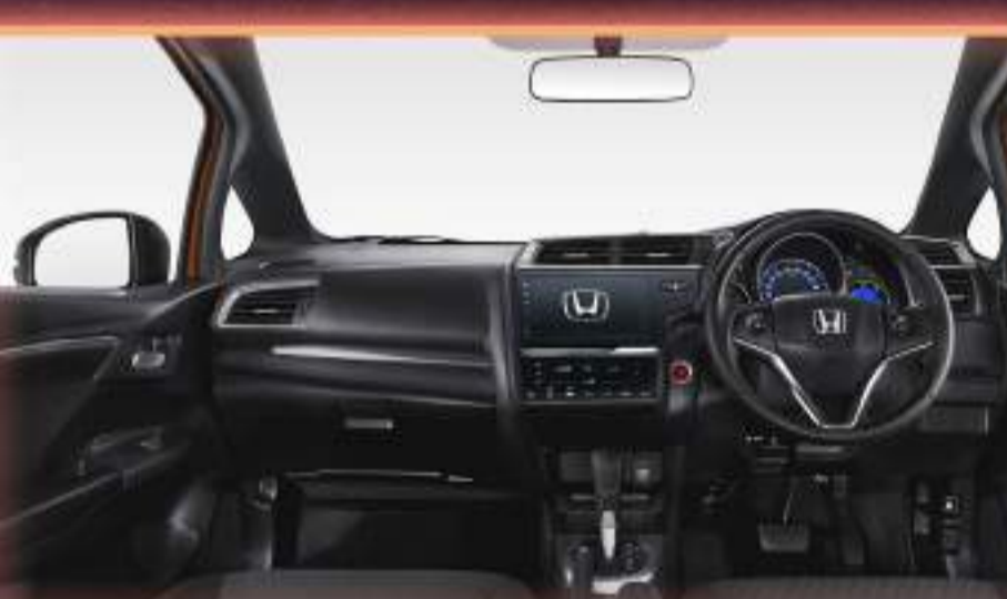
NEW JAZZ RS