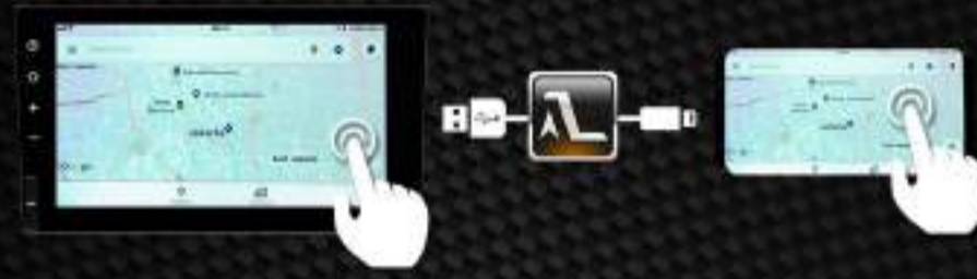
Two-way mirroring for Android (Dengan menggunakan aplikasi Autolink )

Dilengkapi dengan fitur USB mirroring untuk memunculkan tampilan dari Android dan iPhone yang dapat terlihat lebih jelas pada layar sistem audio video menggunakan kabel USB.