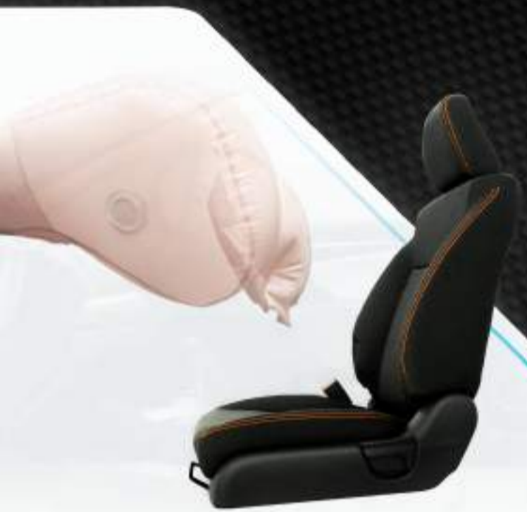
DUAL FRONT SRS AIRBAGS

Bagi Honda kegembiraan dan keseruan berkendara, harus didukung dengan sistem keselamatan yang baik. Inilah prioritas Honda yang hadir pada New Honda Jazz , memberikan perlindungan optimal untuk Kamu saat berkendara.