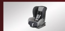
ISOFIX CHILD SEAT