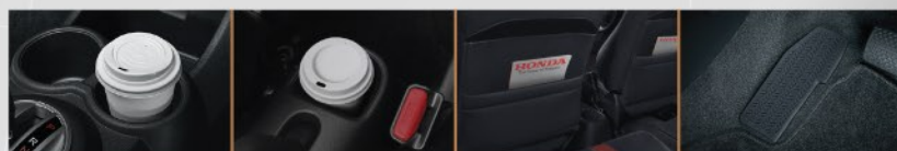
FRONT CENTER CONSOLE CUP HOLDER