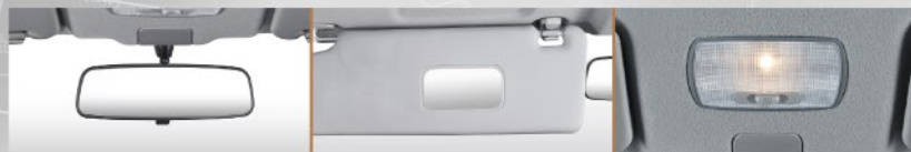
DAY/NIGHT REAR VIEW MIRROR