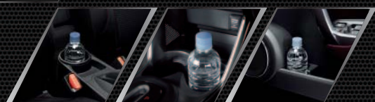
Rear Console Cup Holder