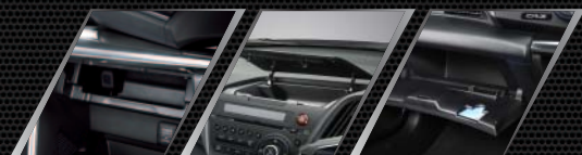
Storage Pocket + USB Connector