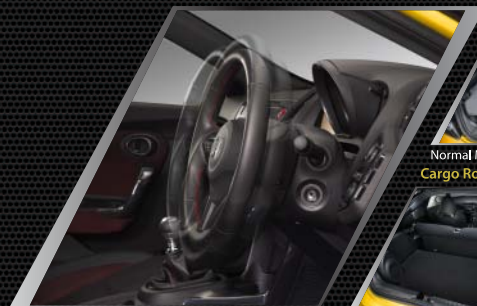
Tilt & Telescopic Steering