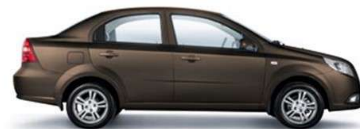
Перламутр коричневый (GD8)