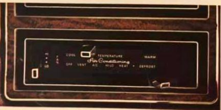
Clima artificial "SelectAir" instalado de fábrica con salidas integradas en el tablero. Aire renovado constantemente y temperatura a su gusto.