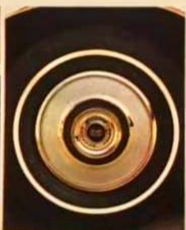
Nuevos tapones de gran lujo.