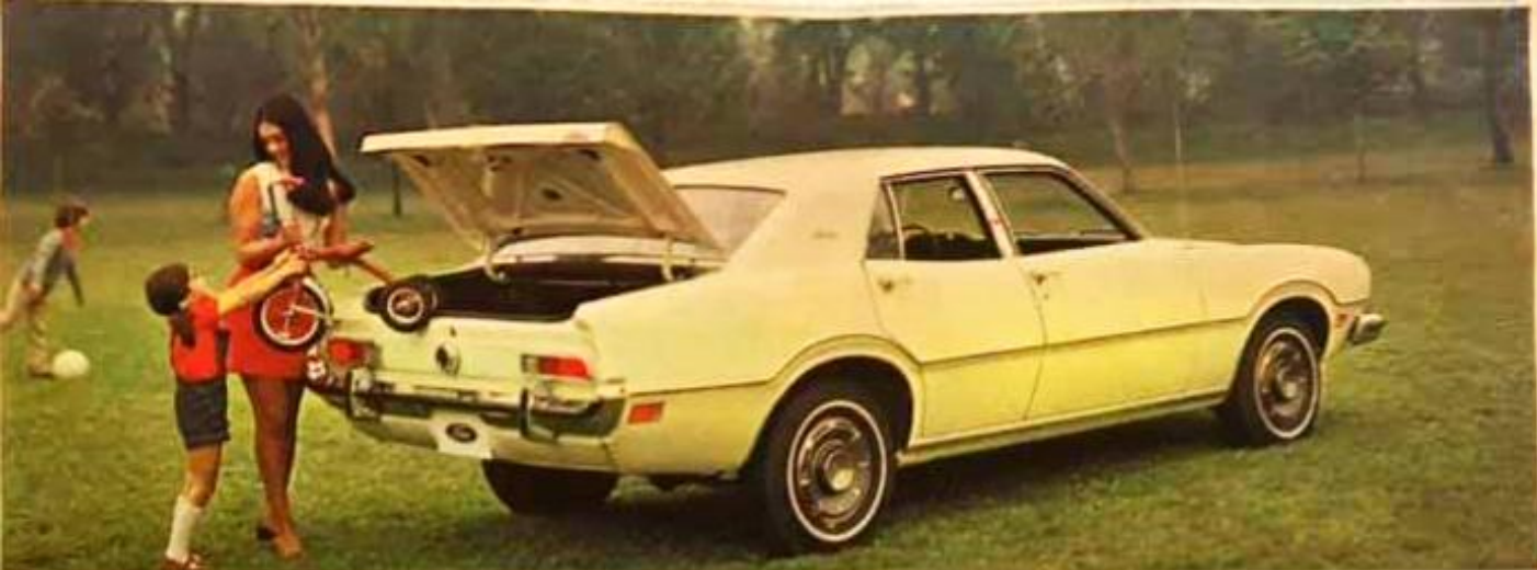
Ford Maverick, sedán 4 puertas