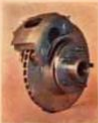
Frenos de disco delanteros. No pierden su efectividad ni estando mojados.