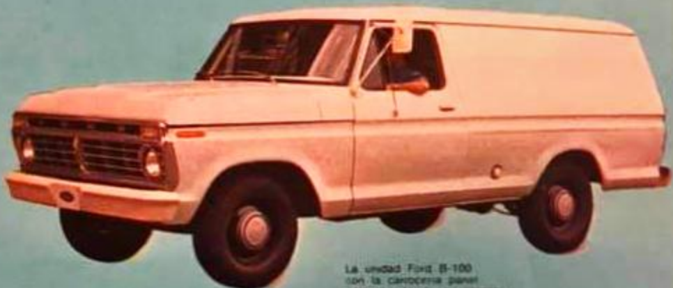
La unidad Ford B-100 con la carrocería panel para reparto de mercancías.