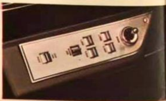
Conveniente tablero de controles en el descansabrazos, para subir y bajar eléctricamente los cristales de las ventanas y los seguros de las puertas. (Opcional). Incluye el control remoto del espejo lateral.