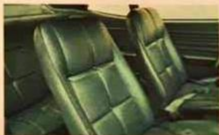
Ricos interiores. Bien acojinados asientos. Confort para todos los ocupantes.