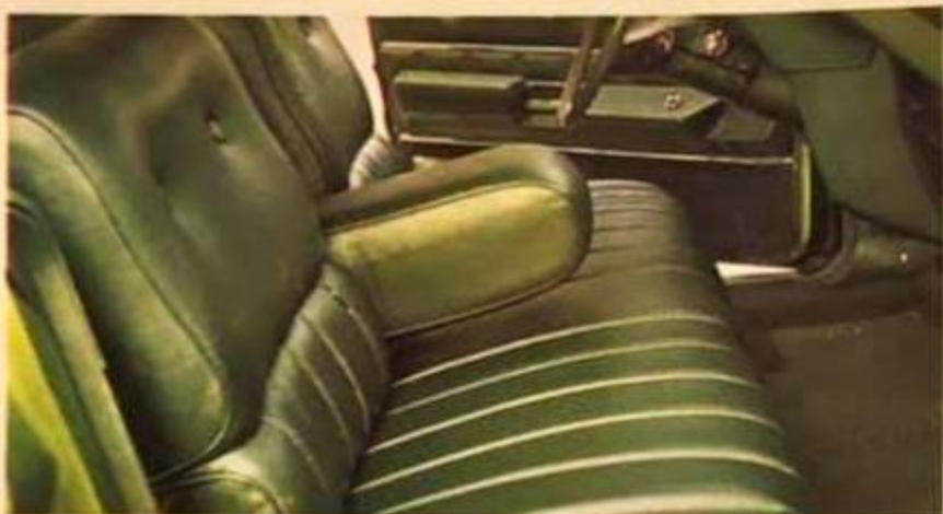
Nuevo concepto anatómico de los asientos. Máxima comodidad.