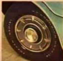
Tapones de lujo como equipo standard. Llantas radiales como opción.