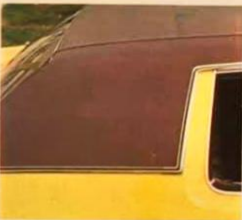
Tubo de vinilo instalado de fábrica en una variada gama de colores, entornados con los de la carrocería y los interiores.