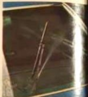
Como equipo standard, lavaparabrisas de regalo total, montados en los limpiadores del parabrisas.