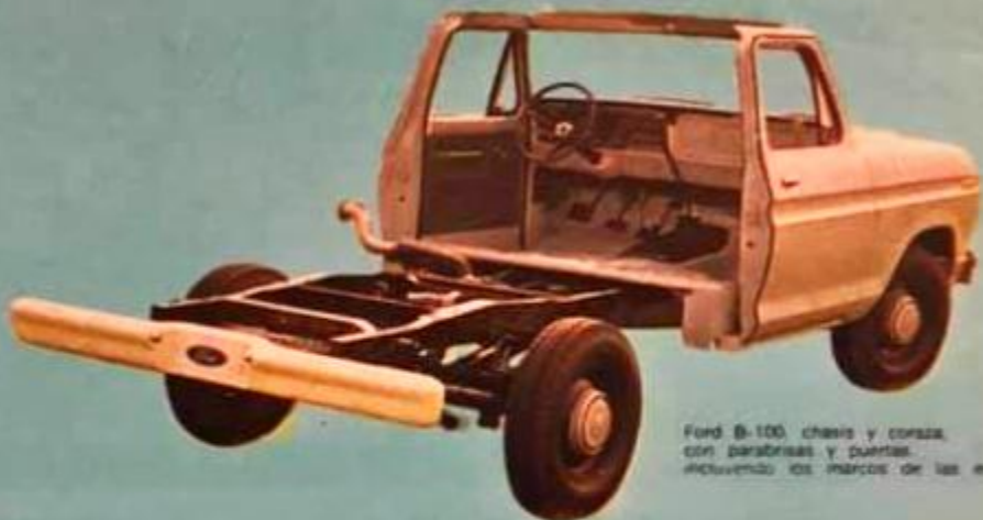
Ford B-100, chasis y carrocería, con parabrisas y puertas, incluyendo los marcos de las mismas.

Las unidades Ford B-100 tienen todas las ventajas características de la F-100, como la exclusiva suspensión de ejes gemelos, los frenos de disco delanteros y el potente motor Ford V-8, consagrado por la experiencia. La diferencia está en que la F-100 está diseñada para una fácil adaptación al uso que usted quiera o necesite darle, como: panel, minibus, ambulancia, "camper" y muchas posibilidades más.