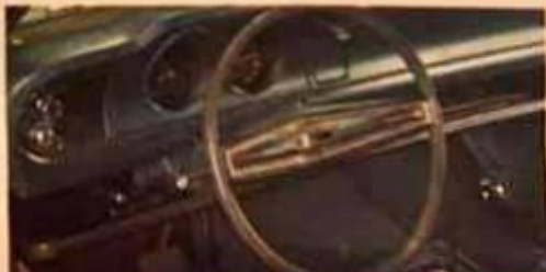
Moderno y funcional tablero con instrumentos y luces indicadoras de lectura instantánea. Tablero y volante ahora en el mismo color de los interiores.