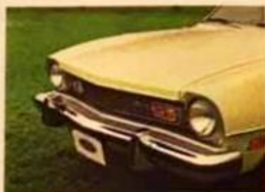
Parilla con grandes cuernos de luz integrados.

Estilo juvenil y amplitud familiar. Su exclusiva suspensión le da excepcional estabilidad y suave marcha. Por todo esto, puede ser el automóvil joven de la familia... o el automóvil de la familia joven.