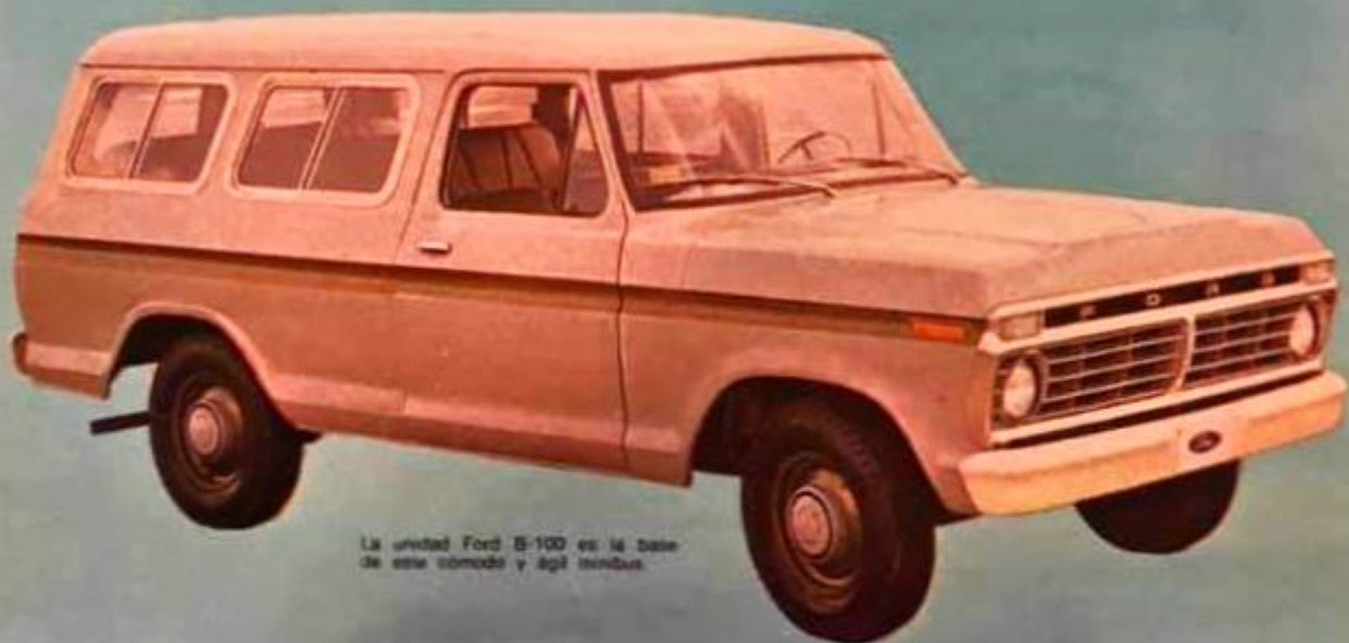
La unidad Ford B-100 es la base de este cómodo y ágil minibus.

ATENCIÓN Y SERVICIO EN 115 CIUDADES DE LA REPUBLICA A TRAVÉS DE LA RED DE CONCESIONARIOS FORD.