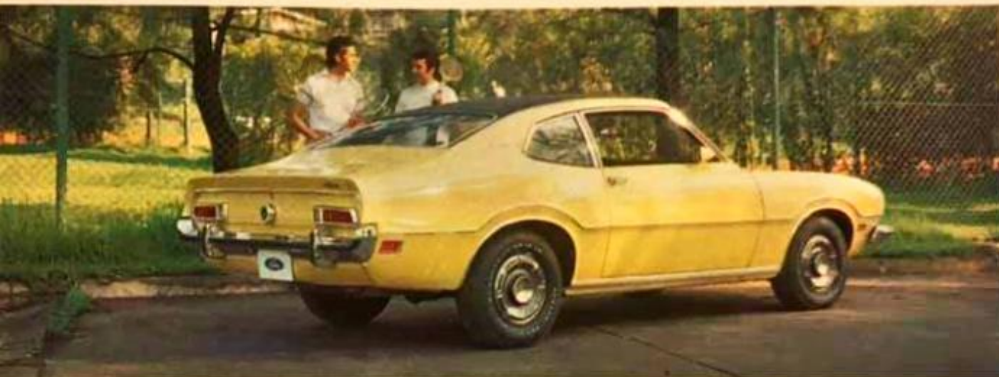
Ford Maverick, sedán 2 puertas