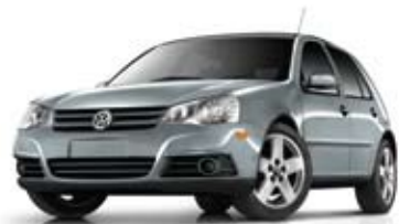
Gris Vulcan métallisé