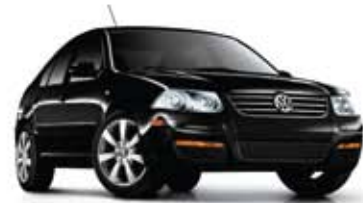
Noir profond nacré