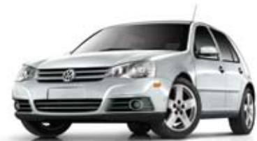
Argent Reflex métallisé