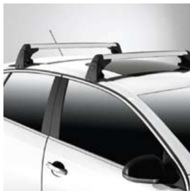
Porte-équipement de base pour porte-skis, porte-vélo et porte-planches à neige