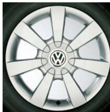
Roues Las Vegas de 16 po