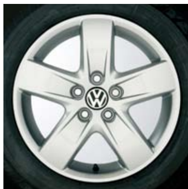
Roues Solstice de 15 po