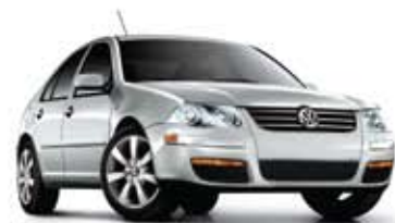
Argent Reflex métallisé