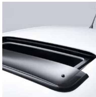
Déflecteur de toit ouvrant