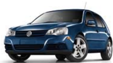
Bleu mystique métallisé