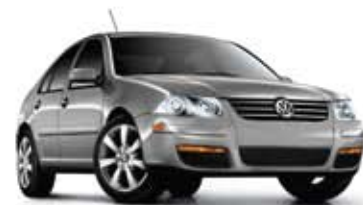
Gris platine métallisé