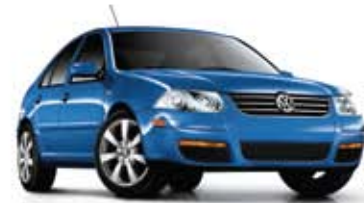
Bleu tossa métallisé