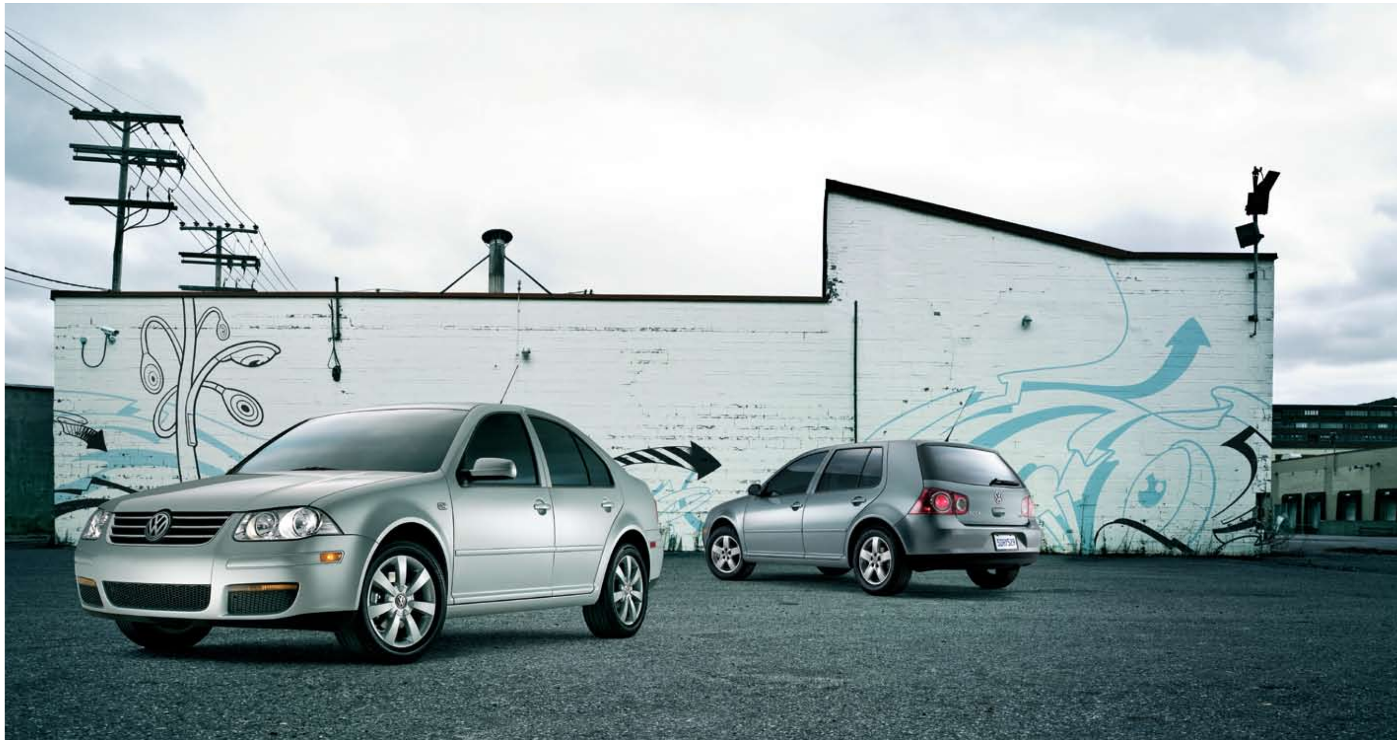
Jetta City et Golf City montrées avec Ensemble confort en option.