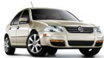
Beige blé métallisé