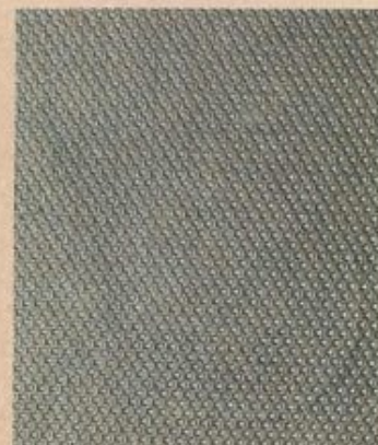
TAPICERIA DE ASIENTOS