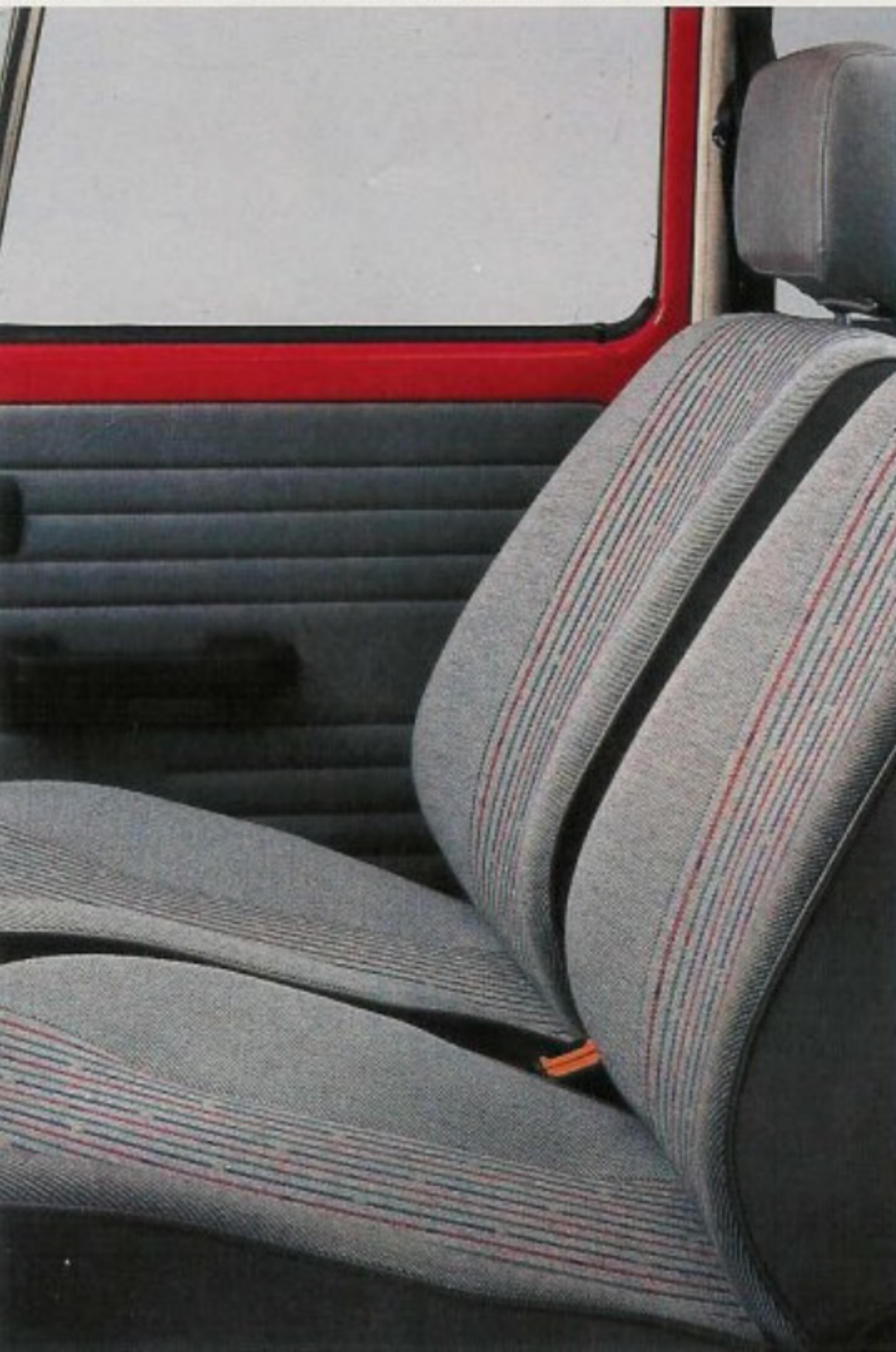
Espacioso habitáculo. Asientos anatómicos individuales.