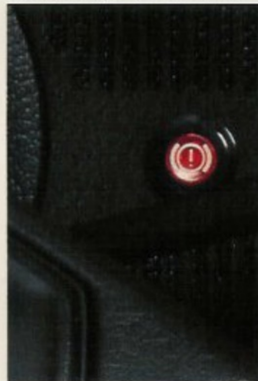
Indicador de presión de frenos.