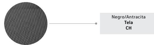
Negro/Antracita Tela CH