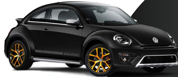
Negro Profundo (2T2T) (Perlado)