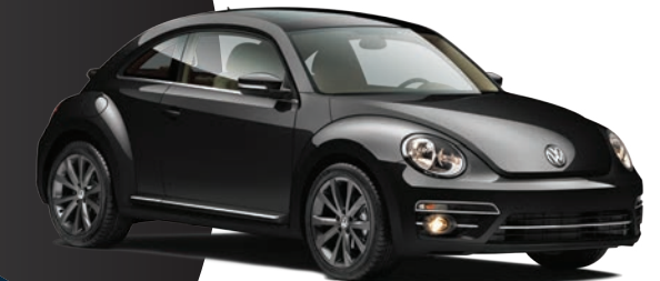
Negro Profundo (A1A1) (Perlado)