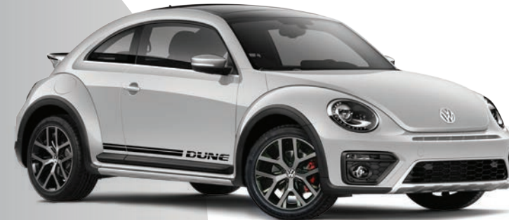
Blanco Candy (0QA1) (Sólido)