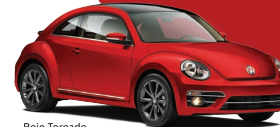
Rojo Tornado (G2G2) (Sólido)