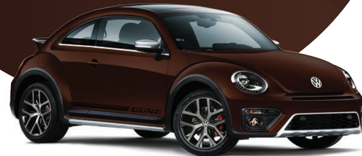
Bronce Oscuro (2JA1) (Metálico)