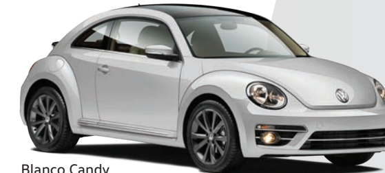
Blanco Candy (B4B4) (Sólido)