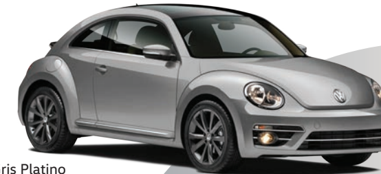
Gris Platino (2R2R) (Metálico)