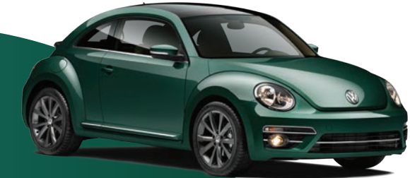
Verde Botella (V8V8) (Metálico)