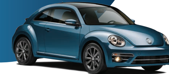
Azul Seda (2B2B) (Metálico)