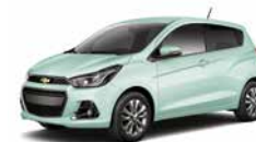
Mint My Mind