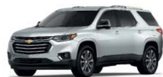
SILVER ICE METALLIC (СЕРЕБРИСТЫЙ МЕТАЛЛИК)