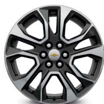
20 × 8,0, легкосплавные Light Argent (для комплектации Premier)