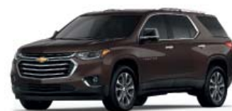
SABLE BROWN METALLIC (КОРИЧНЕВЫЙ МЕТАЛЛИК)