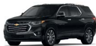
MOSAIC BLACK METALLIC (ЧЁРНЫЙ МЕТАЛЛИК)