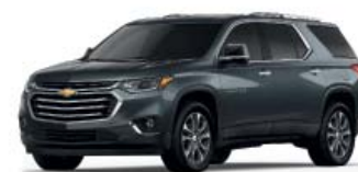
GRAPHITE METALLIC (СЕРЫЙ МЕТАЛЛИК)