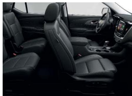
Интерьер чёрного цвета с акцентами из натуральной перфорированной кожи Jet Black (для комплектации Premier)