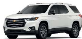
IRIDESCENT PEARL TRICOAT (БЕЛЫЙ МЕТАЛЛИК)