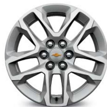
18 × 7,5, легкосплавные Bright Silver (для комплектации LT)