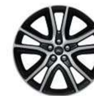
Aluminio Pintado de 20"

Los colores mostrados pueden variar de acuerdo a la resolución de pantalla, favor de consultar especificaciones de color con su distribuidor autorizado Ford antes de realizar su compra.