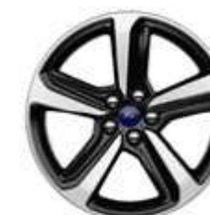
Aluminio de 18"