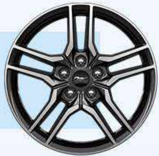
EcoBoost® Aluminio 18"