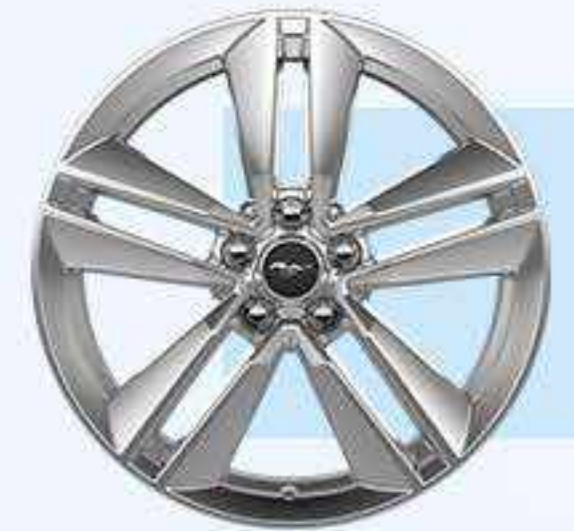
V8 TM / V8 TA y V8 Convertible Aluminio 19"