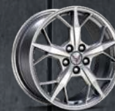
PLATA/ PLATA BRILLANTE