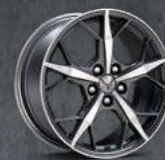
MIDNIGHT/ PLATA BRILLANTE