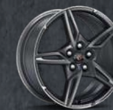
CARBON FLASH OSCURO