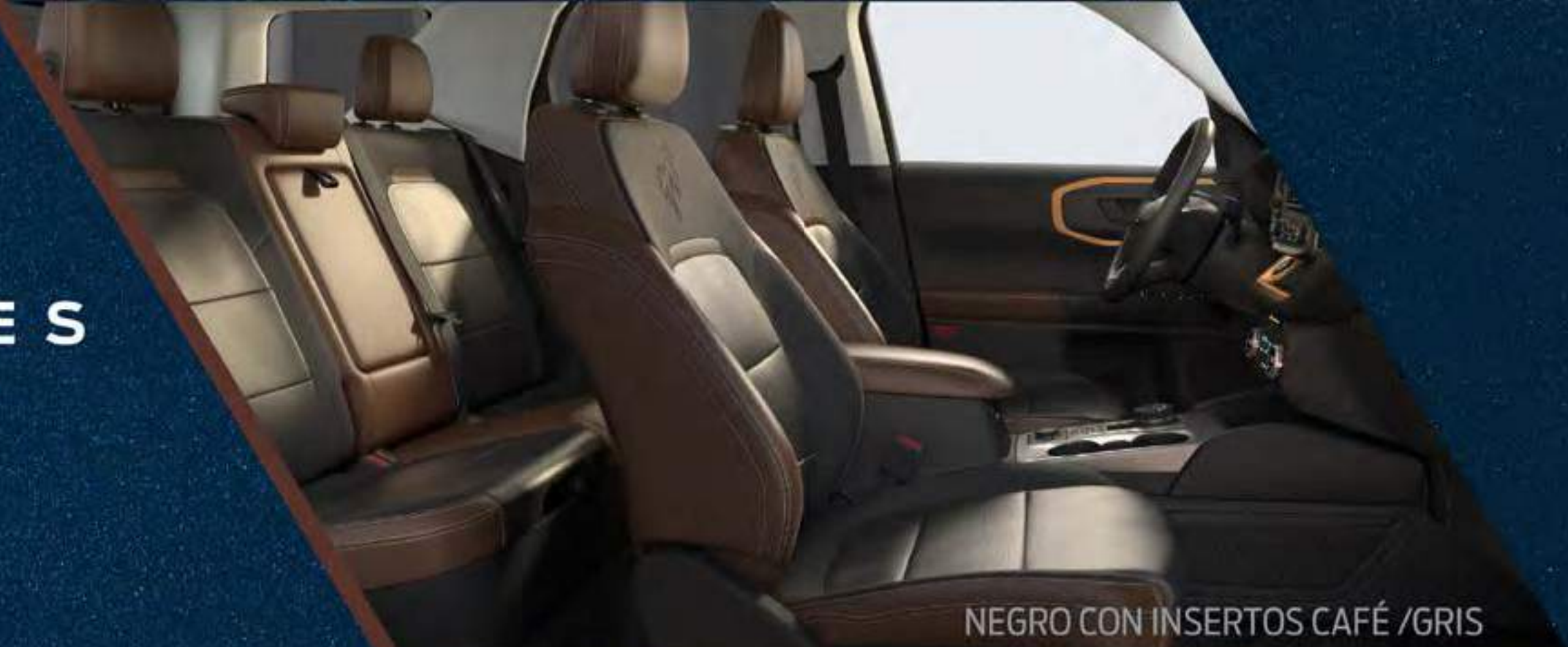
NEGRO CON INSERTOS CAFÉ /GRIS