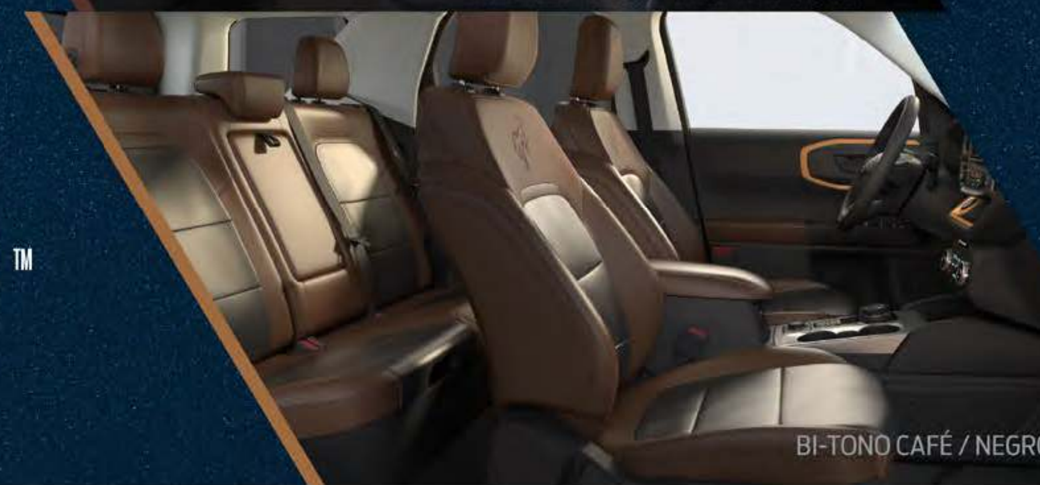
BI-TONO CAFÉ / NEGRO