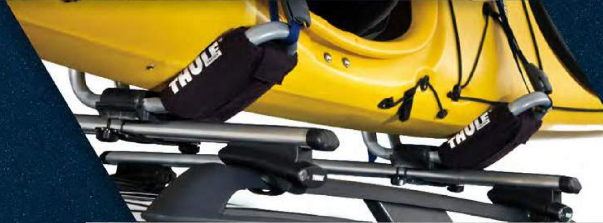
PORTA KAYAK DE TECHO