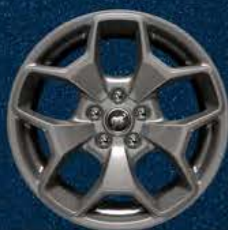
Rines Off-Road de Aluminio en Color Gris Carbono de 17"