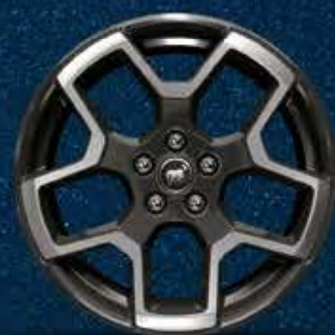
Rines Bi-Tono Negros de Aluminio Maquinado de 18"