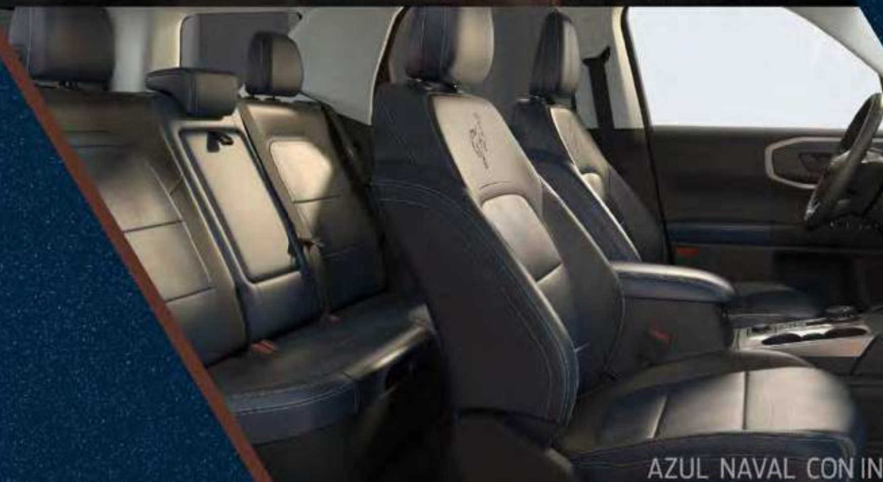
AZUL NAVAL CON INSERTOS EN GRIS