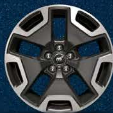
Rines Bi-Tono de Aluminio Cepillado de 18"