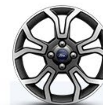
Rines de Aluminio de 17 Pulgadas