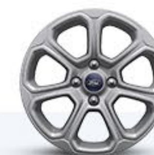
Trend TM y Trend TA Rines de Aluminio de 16 Pulgadas