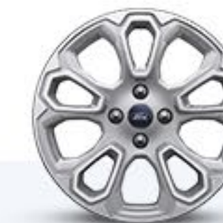
Titanium Rines de Aluminio de 17 Pulgadas