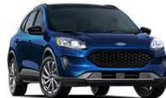
Azul Marino Metálico