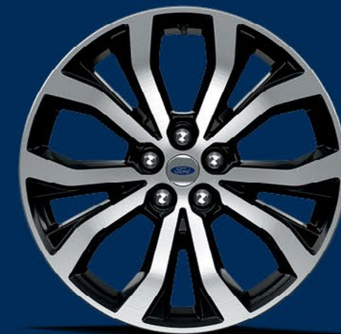
RINES DE ALUMINIO MAQUINADO DE 20 PULGADAS (ST)