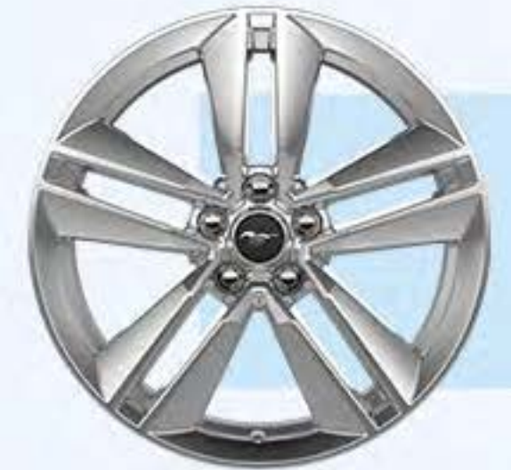
V8 TM / V8 TA y V8 Convertible Aluminio 19"