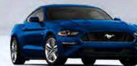
Azul Marino Metálico