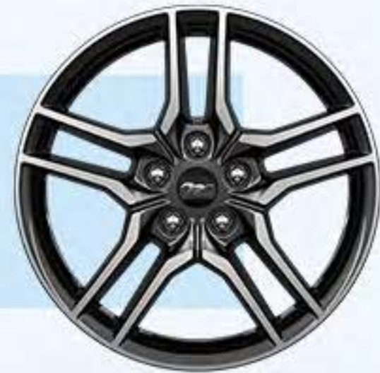
EcoBoost® Aluminio 18"