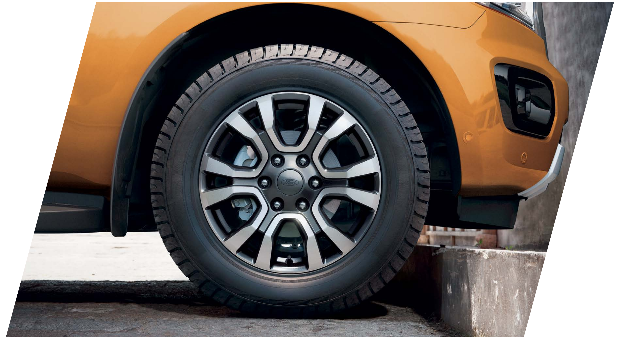
RINES ÚNICOS EN EL PORTAFOLIO DE 18 PULGADAS