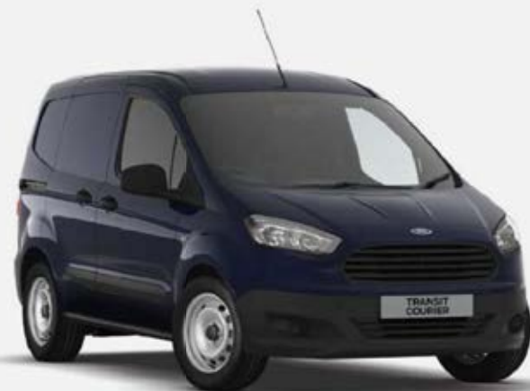
AZUL MARINO BRILLANTE