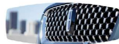
Corsair Grand Touring 2.5L*