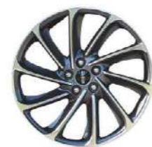
Rines de Aluminio Pintado Premium de 19" Diseño Único PHEV*