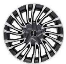
Rines de Aluminio Pulido con Insertos en negro de 20"