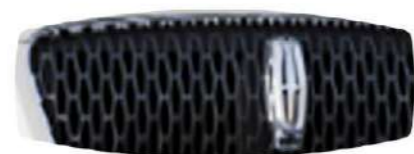
Corsair Reserve 2.3L