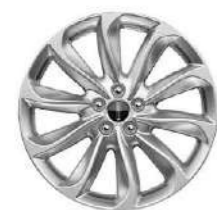
Rines de Aluminio Satinado de 19"