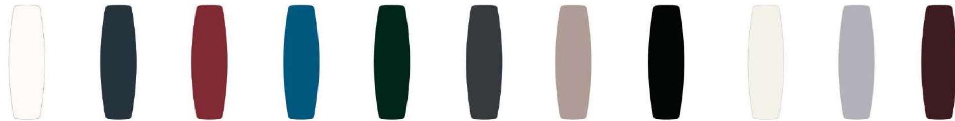
Blanco Capri Cereza Cobalto Esmeralda Grafito* Mocha Obsidiana* Perla Plata Tinto