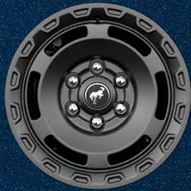
Rines 17" con diseño Everglades en Gris Carbono