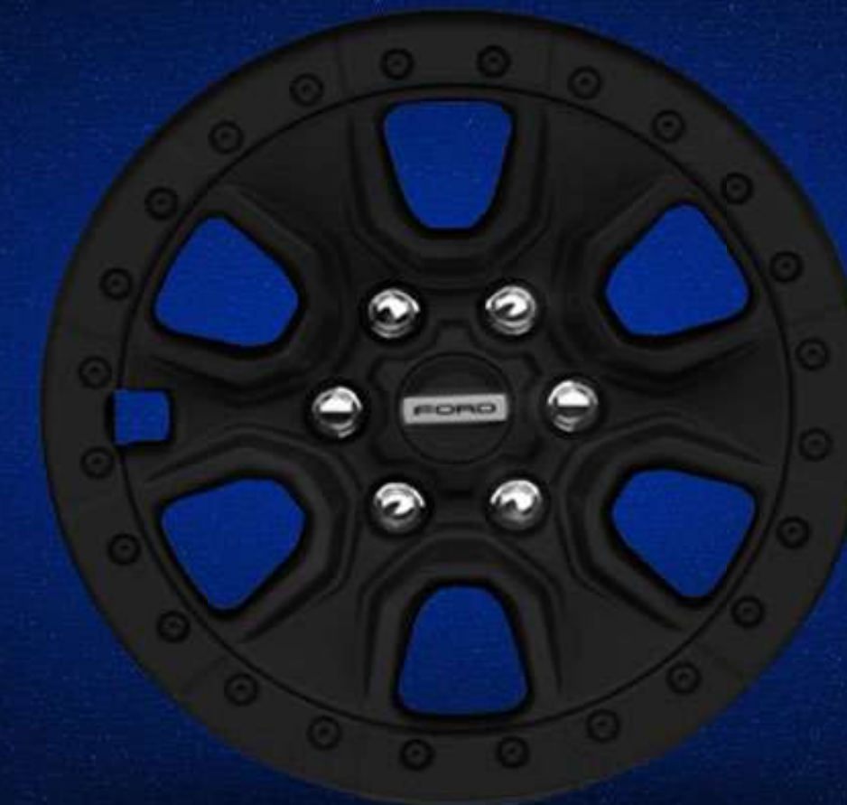
Rines 17" de Aluminio Negro