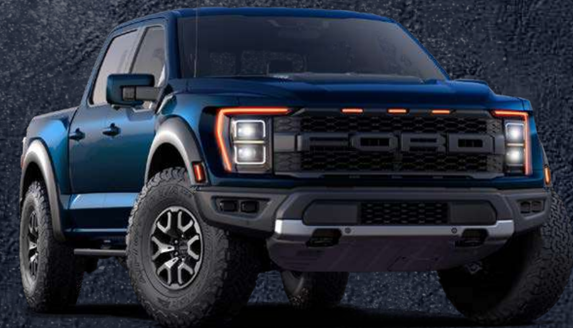
AZUL MARINO METÁLICO