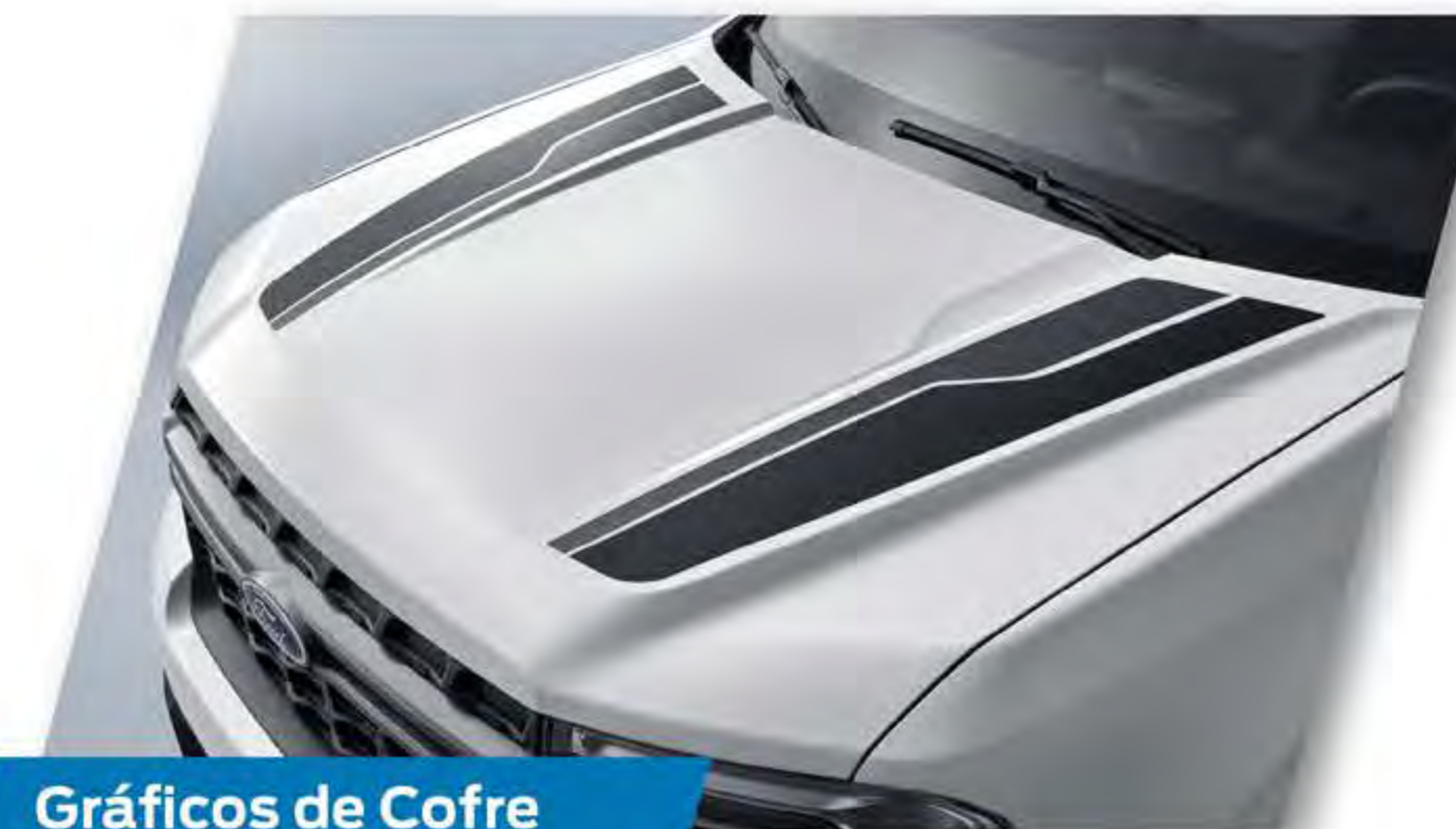
Gráficos de Cofre