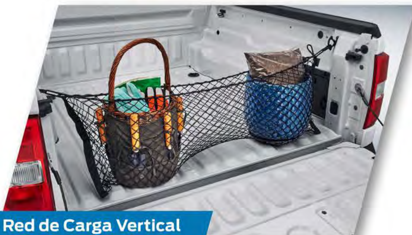
Red de Carga Vertical