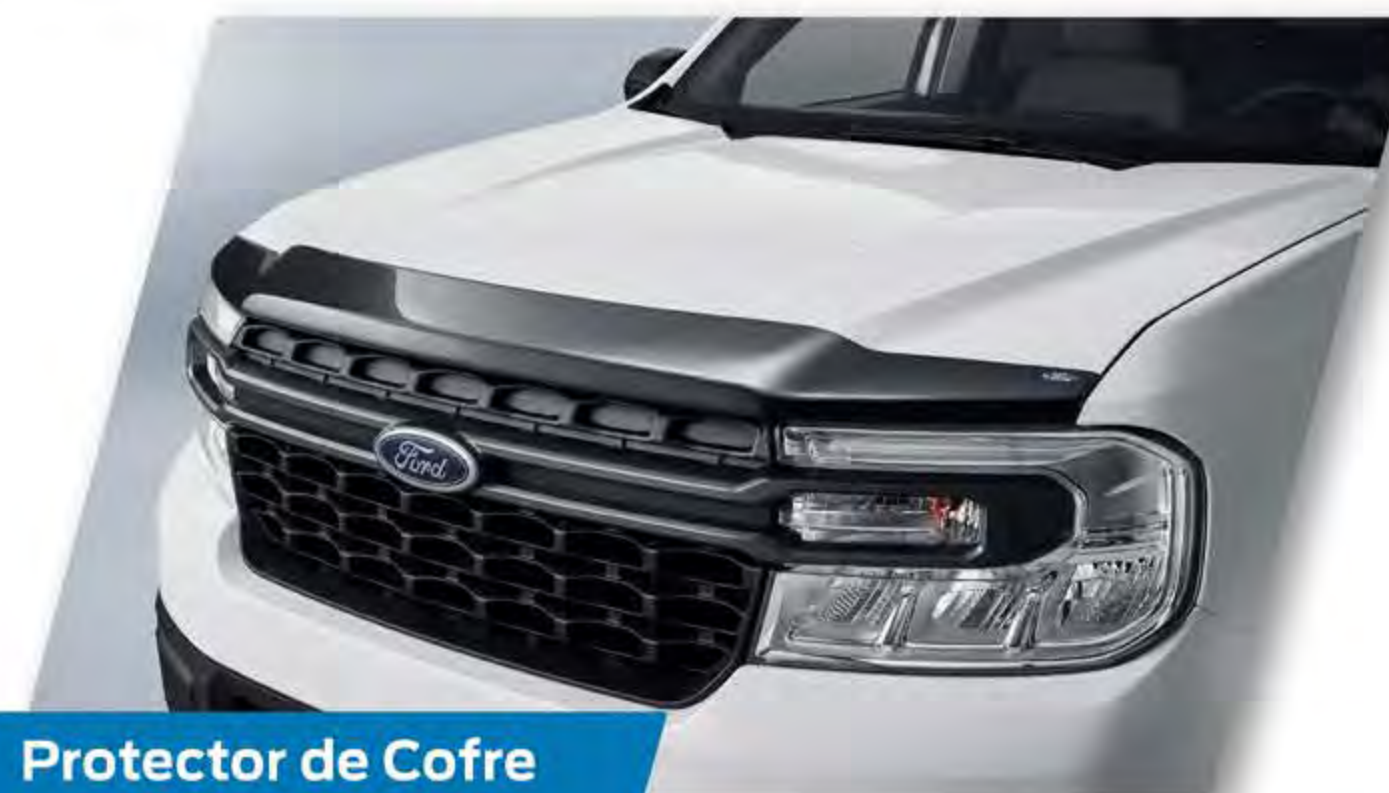
Protector de Cofre