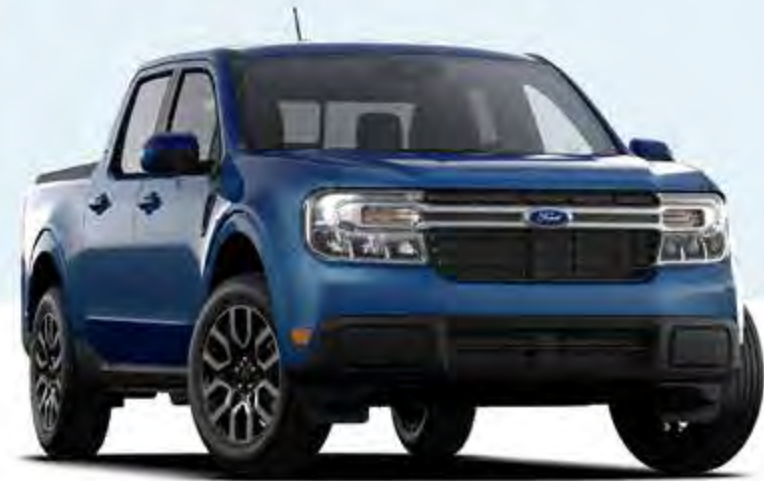
AZUL ALTO METÁLICO