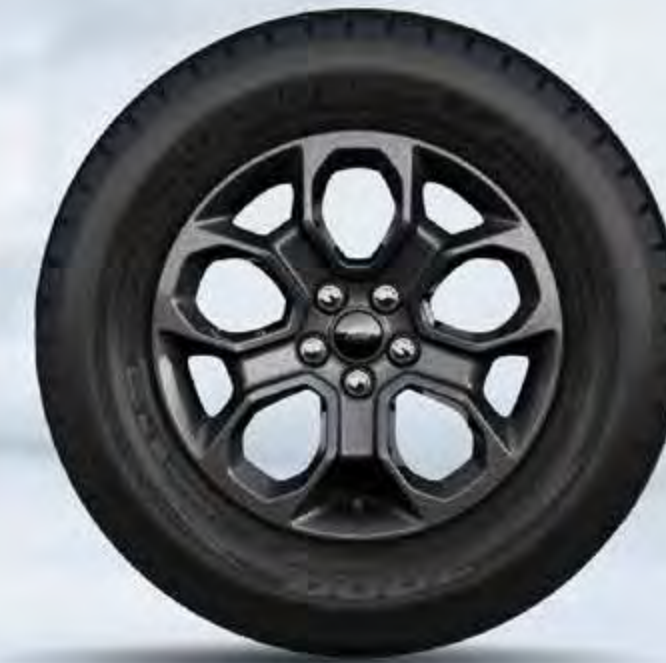
XLT FWD 17 " en Aluminio Pintado (Llantas P225/65R)