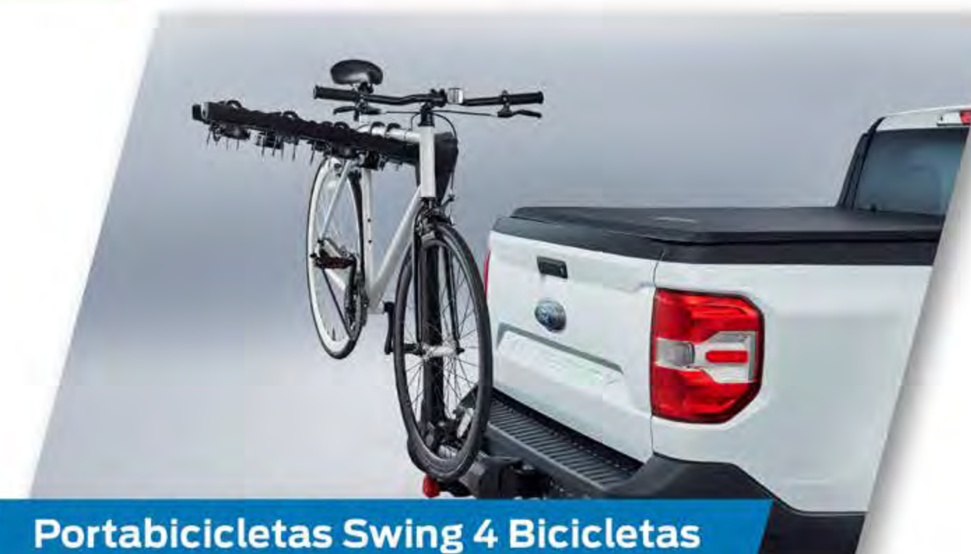
Portabicicletas Swing 4 Bicicletas