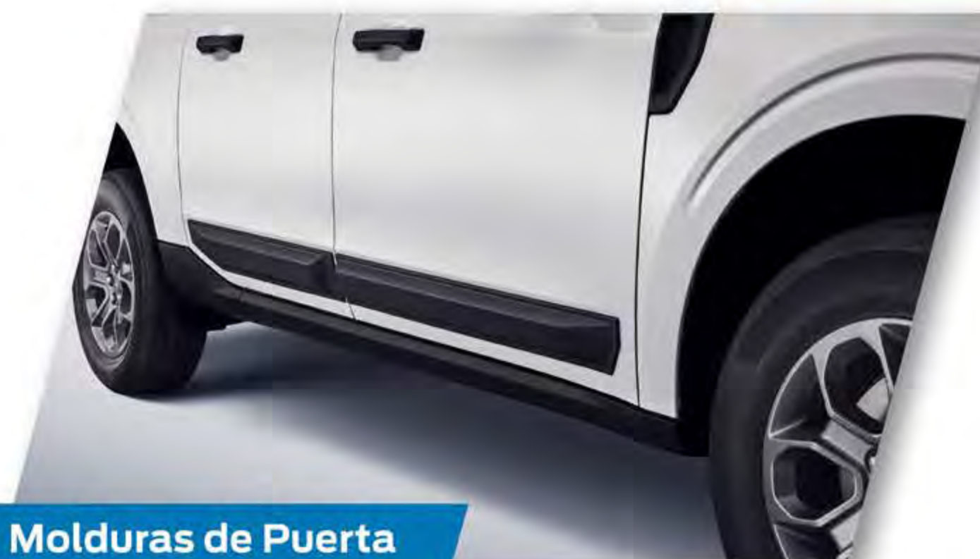
Molduras de Puerta