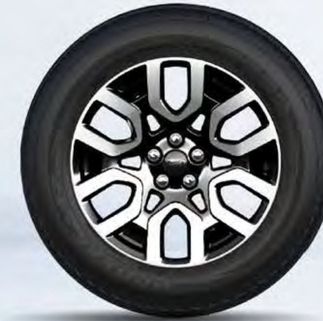
Lariat AWD 18" en Aluminio Brillante (Llantas P225/60R)