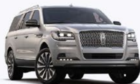
NAVIGATOR RESERVE L