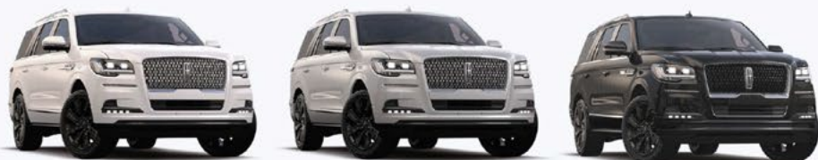
NAVIGATOR RESERVE MONOCROMÁTICA