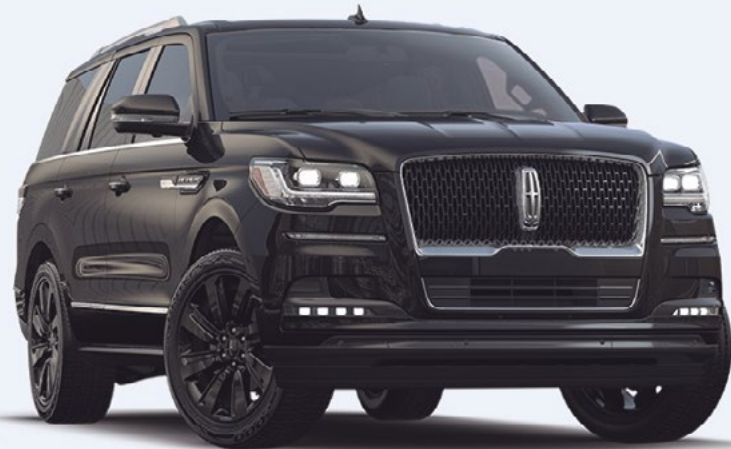
NAVIGATOR RESERVE MONOCROMÁTICA