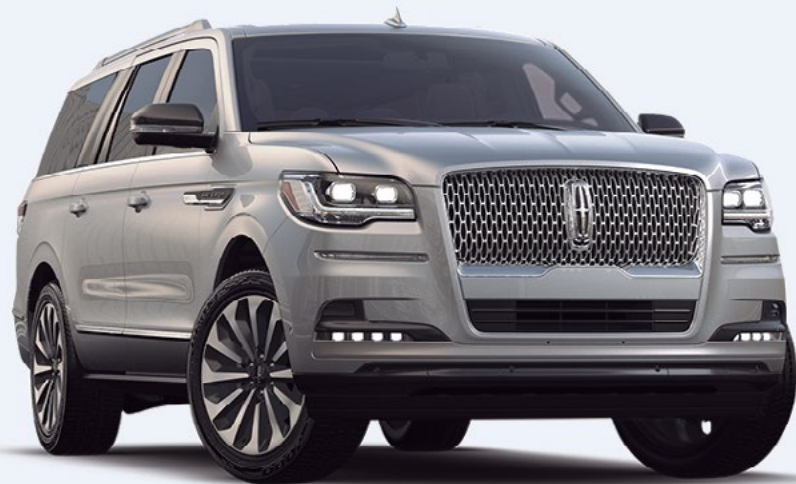
NAVIGATOR RESERVE L