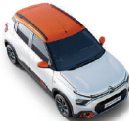
POLAR WHITE BODY WITH ZESTY ORANGE ROOF