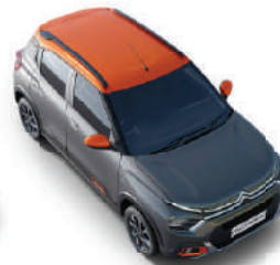
PLATINIUM GREY BODY WITH ZESTY ORANGE ROOF