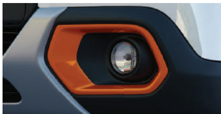
VIBE PACK: ZESTY ORANGE