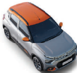
STEEL GREY BODY WITH ZESTY ORANGE ROOF