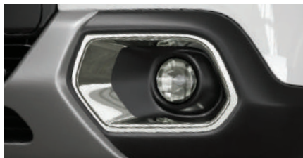
ELEGANCE PACK: CHROME*

*Elegance Pack (Chrome): Dealer Installed