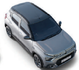
STEEL GREY BODY WITH PLATINIUM GREY ROOF