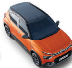
ZESTY ORANGE BODY WITH PLATINIUM GREY ROOF