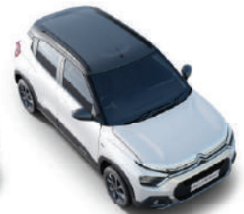
POLAR WHITE BODY WITH PLATINIUM GREY ROOF