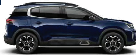
NEW CITROËN C5 AIRCROSS SUV