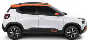
NEW CITROËN C3

Di sekitar kota atau di seluruh negeri, setiap Citroën memiliki DNA desain yang dinamis dan ramah lingkungan yang memberikan kenyamanan murni. DNA inilah yang diterjemahkan dengan sempurna melalui persembahan Citroën berupa hatchback dengan desain unik dan SUV kelas Comfort.