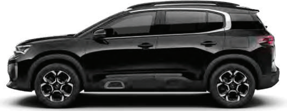
PEARL NERA BLACK