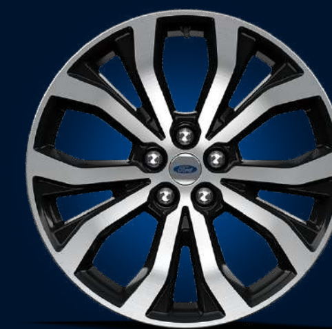
Rines de Aluminio Maquinado de 20 Pulgadas (ST)