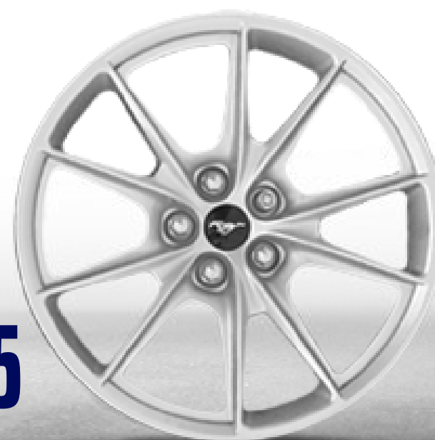
19 X 8.5 PULGADAS DE ALUMINIO