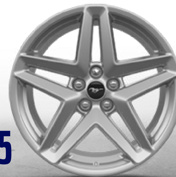
19 X 8.5 PULGADAS DE ALUMINIO*

*Para más detalles acércate a tu distribuidor autorizado Ford más cercano