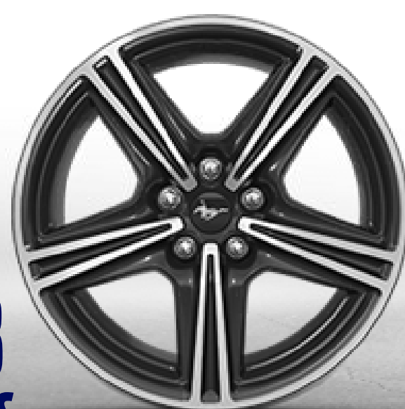
18 X 8 PULGADAS DE ALUMINIO PINTADOS EN NEGRO