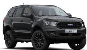
Panther Black 银沙黑