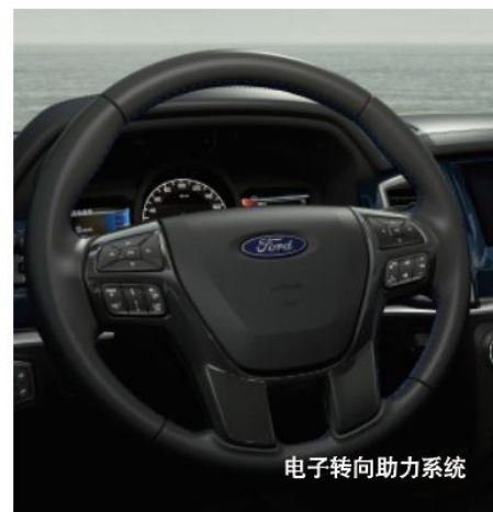
电子转向助力系统