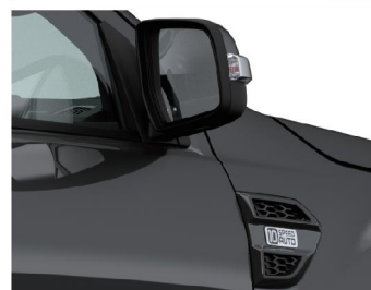
熏黑后视镜翼子板