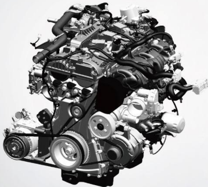
2.3L EcoBoost GTDI 涡轮增压汽油发动机

2020款福特撼路者配备EcoBoost 2.3T涡轮增压发动机，采用D-VVT技术和双流道技术，能够极大程度降低发动机在低速时涡轮迟滞，提升动力响应，持续输出强劲动力。再加上EcoBoost增压和可变机油压力机油泵主动控制技术，以及四桃尖式低摩擦高压油泵技术，可以提高发动机工作寿命的同时，进一步降低发动机噪声和油耗。