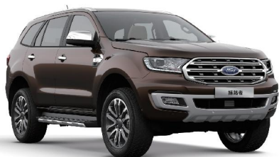
Autumn Glaze 熔岩棕