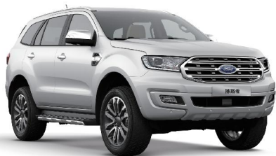
Peal White 珠光白