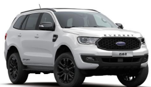
Peal White 珠光白