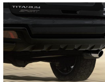
熏黑前后保气管造型