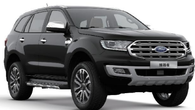
Panther Black 银沙黑