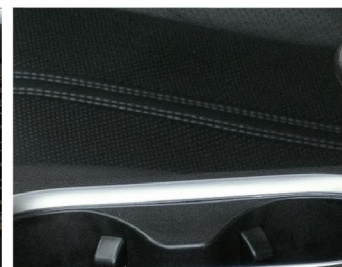
时尚运动蓝色缝线内饰