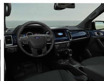
奢华转水印蓝宝石控制台