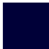
MINI Yours Lapisluxury Blue