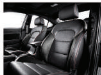
Sport-Line 紅色車縫線皮革座椅