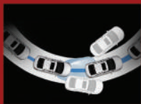
VSM 整合式車身動態管理系統