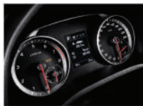
圓形立體式自發光儀錶板