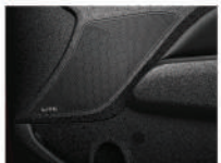
8支 INFINITY 頂級揚聲系統