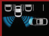
RCTA 後方交通警示系統