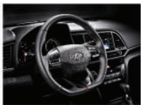
賽車化平底真皮方向盤