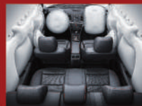
全車 6-SRS 輔助氣囊