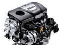
Gamma 1.6 Turbo 渦輪增壓引擎