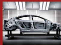
53% AHSS 先進高剛性鋼材