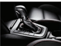
7速 DCT 雙離合器手排