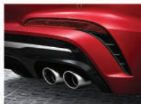
賽道化雙出鍍鉻尾管