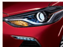
HID Bi-Function 投射式頭燈 LED 鑽帶日行燈