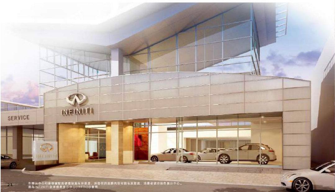
各廠派中心和維修站均提供專車專修，而您的服務內容可能因其差異。消費與服務均請留意中心，最為INFINITI全線服務派派中心(PRED)所委辦。

當科技不斷進化 你的潛能也隨之覺醒，以更敏銳的感知 更敏捷的反應，和更精準的掌控 驅使你 駕馭未知 駕馭無限