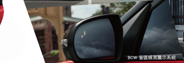
BCW 盲區偵測顯示系統