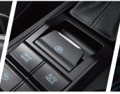
EPB 電子式手煞車 Auto Hold 自動駐車系統