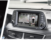
AVM 環影影像輔助系統

*AVM 影像輔助系統僅為 1.6L 車款，特殊規格以實車為準。 *Auto Hold 系統僅限於部分車款，非由油門控制系統失效引起，或由於駕駛者操作不當導致系統失效。 *AVM 影像輔助系統僅為部分車款，特殊規格以實車為準。