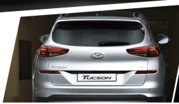
矩陣式 LED 尾燈組 高麗式 LED 第三煞車燈