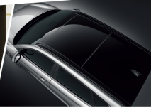
鍍鉻鍍化車頂行李架 大全景玻璃天窗 (輕量鋼 / 防夾機制)