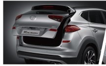
智慧感應式電動尾門