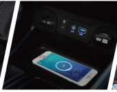
手機無線充電裝置