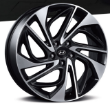
18吋渦輪扇葉式雙色鋁圈

橫掃式鍍鉻飾化前車嘴 複層式 LED 頭燈組 LED 定位燈組 L 型 LED 日行燈