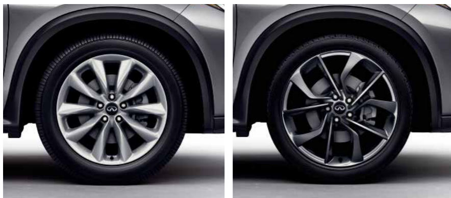
19 吋鋁合金輪圈 (風尚款)