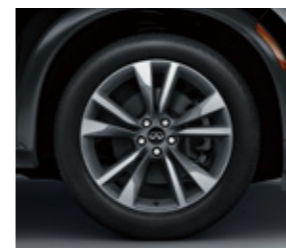
20 吋鋁合金輪圈 (風尚款)