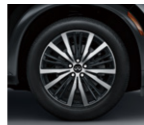
20 吋鋁合金輪圈 (旗艦款)