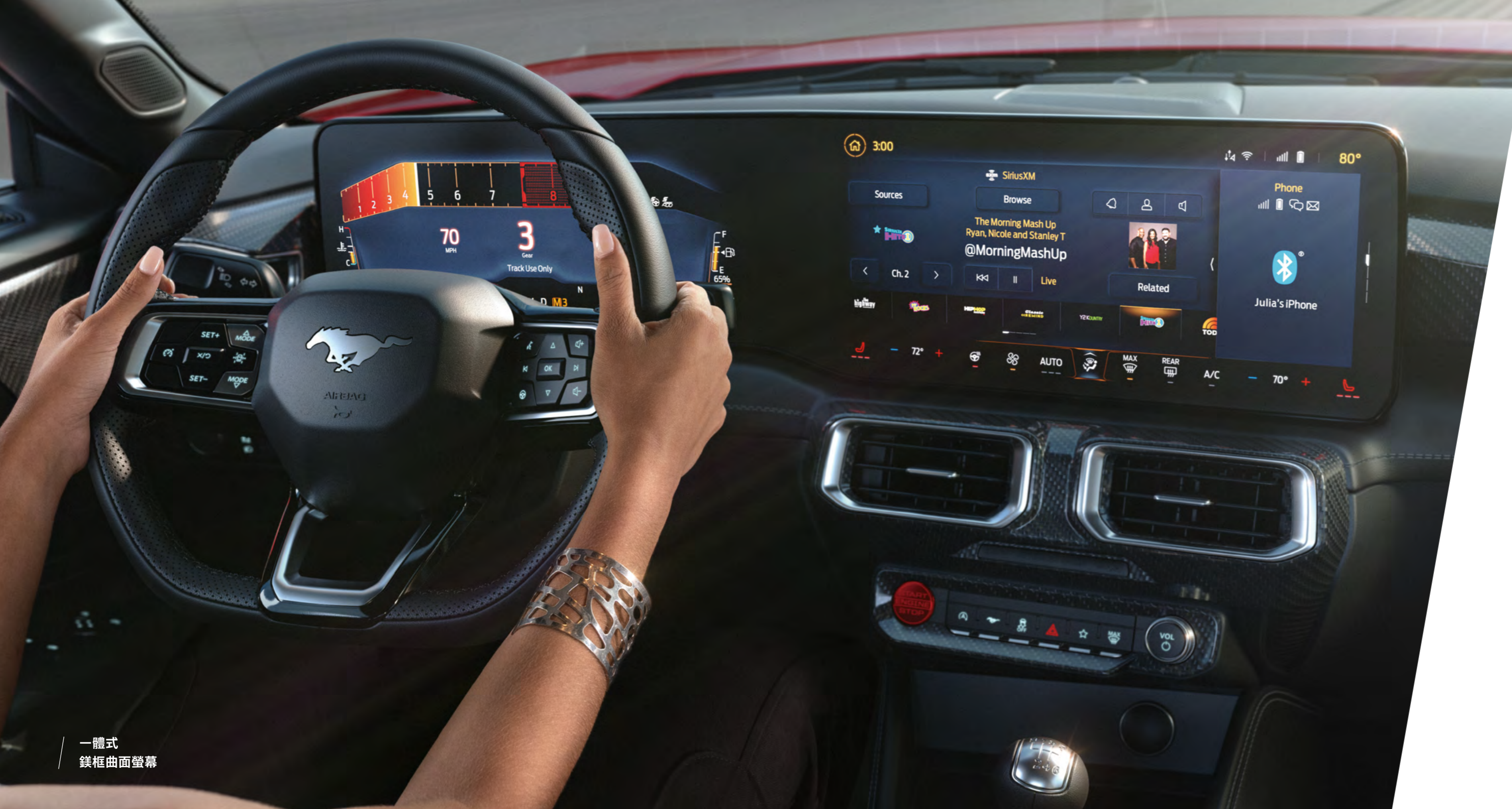
一體式 鎂框曲面螢幕