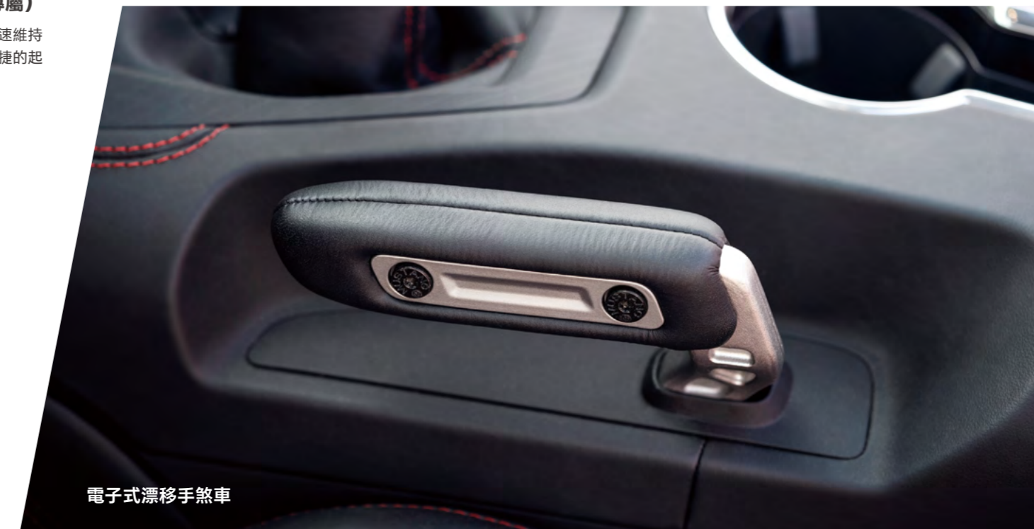
電子式漂移手煞車

領先同級導入電子式漂移手煞車，保留傳統機械手煞車的視覺吸引力及功能，維持甩尾時需要的操作手感；當開啟漂移煞車功能時，每個轉彎都能感受到心臟興奮地跳動聲