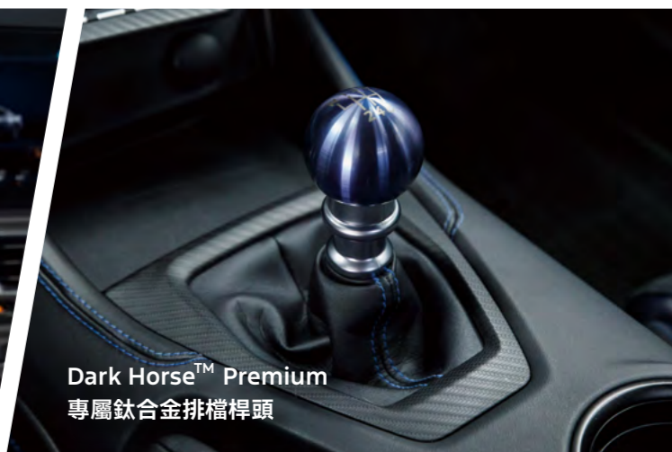
Dark Horse™ Premium 專屬鈦合金排檔桿頭