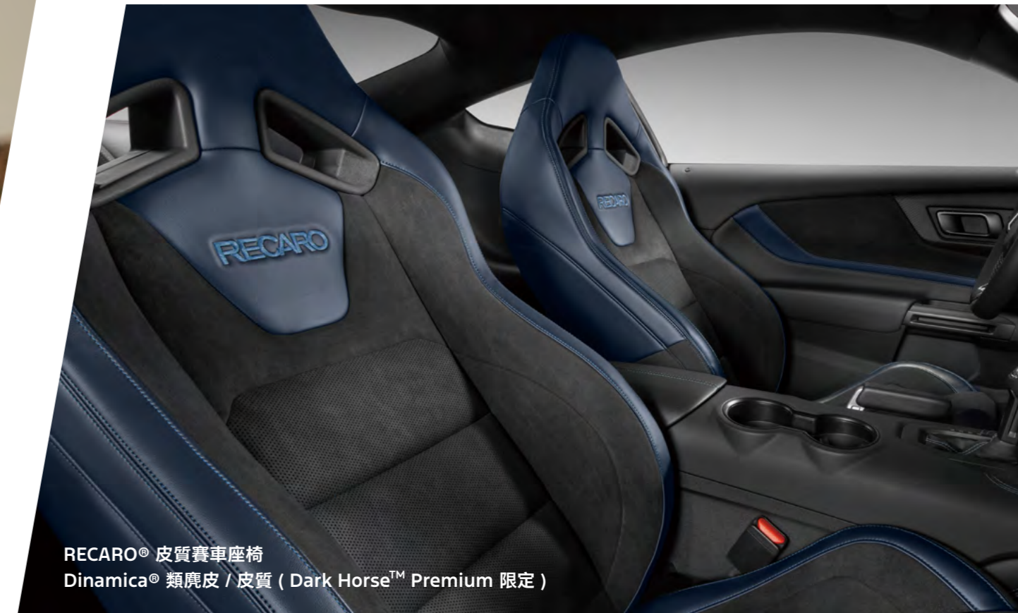
RECARO® 皮質賽車座椅 Dinamica® 類麂皮 / 皮質 ( Dark Horse™ Premium 限定 )