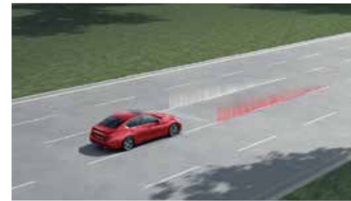
LDP 車道偏移預防系統

能同時監控前車與前前車，當預測到前車與前前車有追撞可能，將立即警示駕駛，為駕駛爭取更多反應時間；當有可能與前車發生碰撞意外時，將主動緊急煞車，讓碰撞發生機率降低。