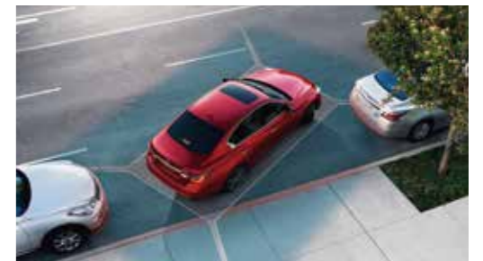
AVM 環景顯示附 MOD 物體偵測

可於倒車時主動偵測後方靜止或移動物體，消除視覺死角，於後方左右兩側偵測到物體時，將發出警示音提醒駕駛，於正後方預測到碰撞危險時，將主動緊急煞車，降低發生碰撞的風險。