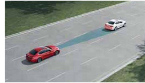
ICC 全域智慧定速系統 DCA 車距控制輔助系統

當車速介於 0-144km/h 時，可依你的偏好設定三段安全車距，並根據前車的速度變化自動加速、減速，達到自動跟車的效果，並同時監控是否與前車保持足夠的安全距離，若與前車距離過近，將自動減速，預防煞車不及的狀況發生。