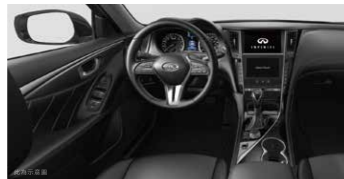
鍍金黑飾板 (豪華款)