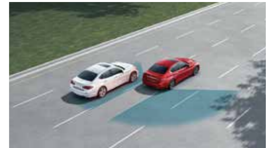
BSI 盲點側撞預防系統

車速於 70km/h 以上時啟動，偵測到車輛非刻意偏移車道時，將即時警示並主動啟動單側煞車協助導正行車方向。