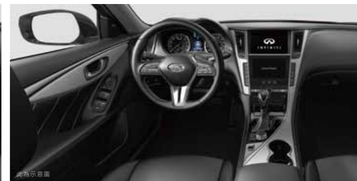
Kacchu 鋁合金飾板 (旗艦款 / SILVER SPORT)