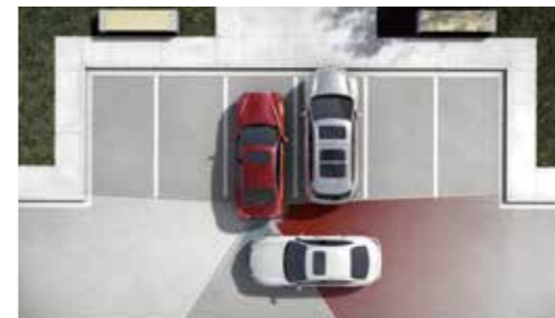
BCI 倒車後撞預防系統

透過後保桿內兩側的遠距感應雷達偵測後方來車，若雷達感知器偵測到偵測區域中有車輛，車側指示燈會自動點亮警示；若此時駕駛欲變換車道，啟動方向燈，車側指示燈會閃爍、發出警示音並主動啟動單側煞車，協助導正行車方向。