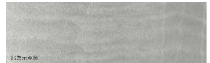
木紋飾板 (旗艦領航版)