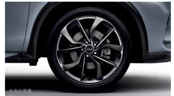
20吋鋁合金輪圈 (旗艦領航版)