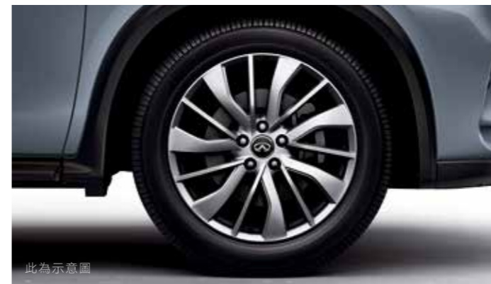
19吋鋁合金輪圈 (豪華/風尚領航版)