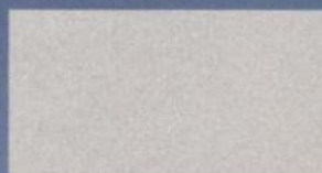
Plateado Abedul Metalizado