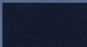
Azul Oscuro Aperlado Metalizado