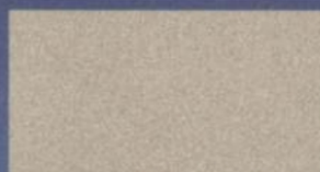
Dorado Pueblo Metalizado