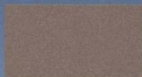
Gris Mineral Metalizado