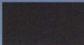
Piedra Oscuro Metalizado