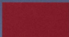
Rojo Fuego Metalizado