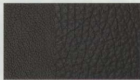
Cuir noir anthracite De série pour Limited