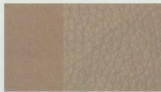
Cuir fauve De série pour Limited