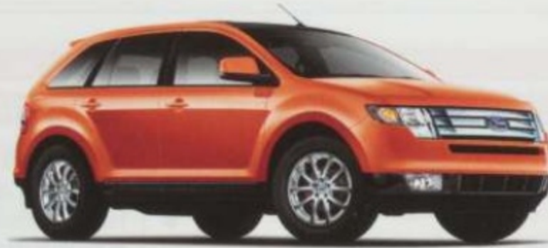
Cuivre flamboyant métallisé