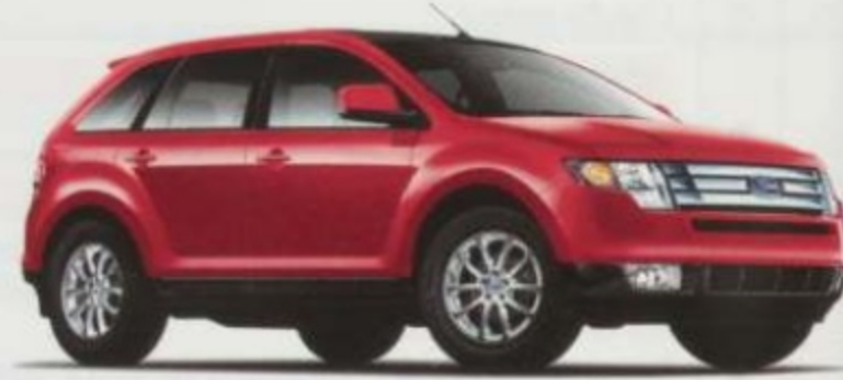
Rouge feu métallisé