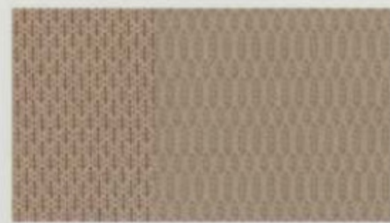
Tissu fauve De série pour SEL