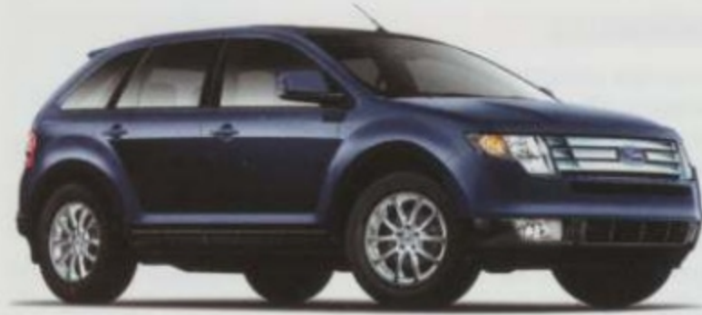
Encre bleu foncé métallisé