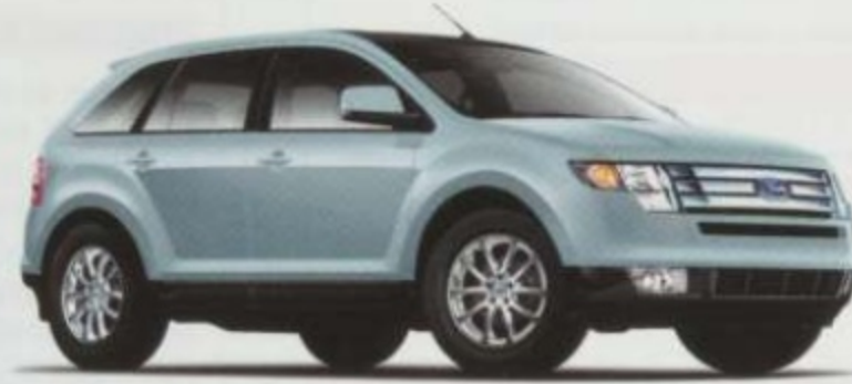
Bleu glacier pâle métallisé