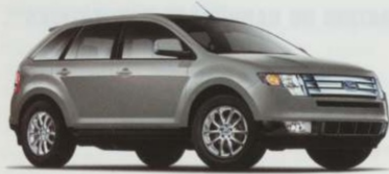
Argent vaporeux métallisé