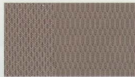
Tissu pierre moyen pâle De série pour SEL