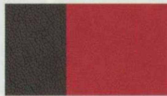
Cuir noir avec empiècements en cuir rouge De série pour Limited avec groupe décor intérieur