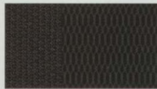
Tissu noir anthracite De série pour SEL