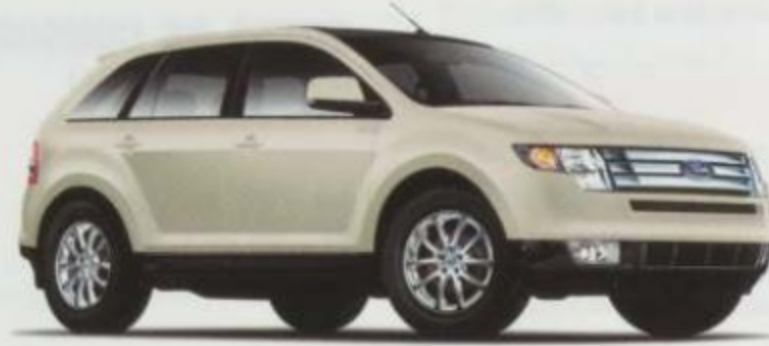
Sable blanc (3 couches) métallisé