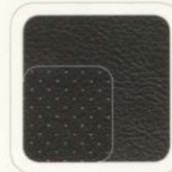
Cuir anthracite foncé avec empiecements perforés De série avec l'ensemble Adrenalin