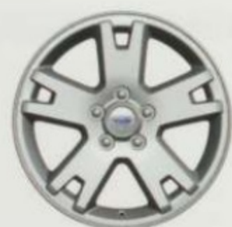
De 17 po en aluminium usiné En option pour XLT