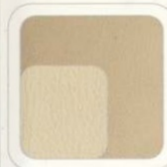
Cuir fauve avec empiecements sable De série pour Limited