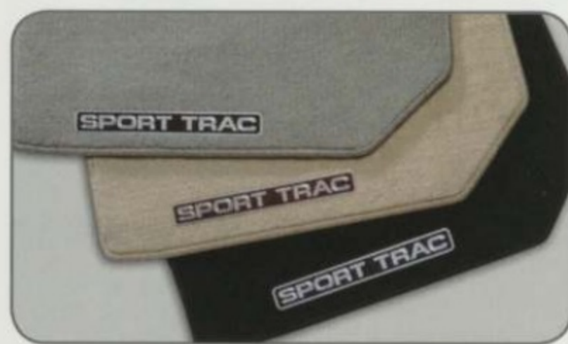
Tapis haut de gamme en moquette