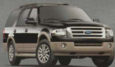
Expedition et Expedition MAX