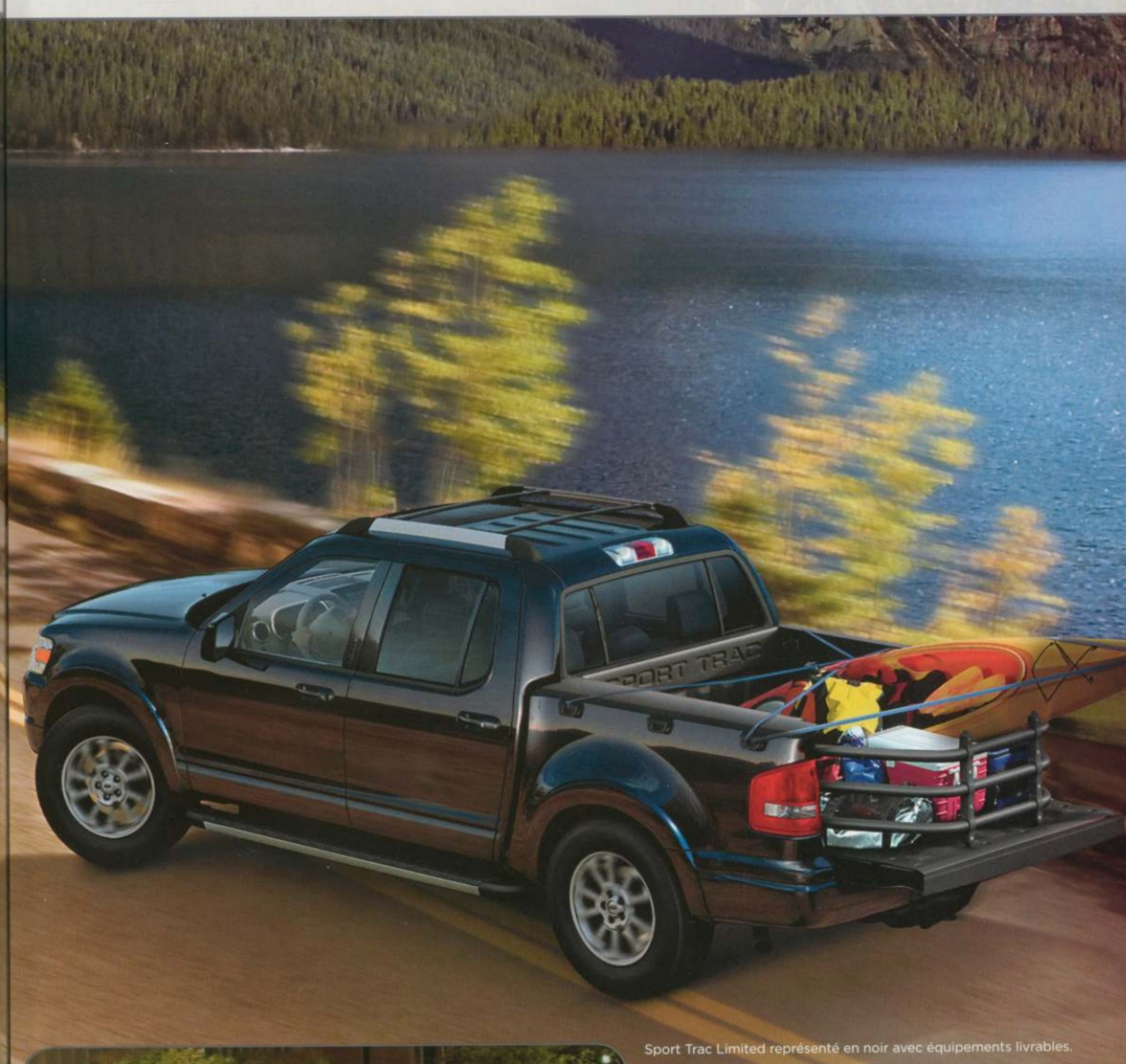
Sport Trac Limited représenté en noir avec équipements livrables.

Peu importe la version du Sport Trac que vous choisirez, vous aurez l'assurance d'être en sécurité grâce au système AdvanceTrac® avec contrôle de stabilité antiretourneement. Ce dispositif électronique évalue des données que les systèmes des autres constructeurs ignorent ou ne font tout au plus qu'évaluer. Il comprend : capteur de capotage, freins antiblocage, antipatinage et contrôle de mouvement de lacet. Le contrôle de stabilité antiretourneement utilise ce capteur pour mesurer directement, au moins 100 fois par seconde, la vitesse angulaire de roulis du véhicule, ce qui contribue à déterminer quand et comment le système doit appliquer les freins individuellement et modifier la puissance du moteur de façon à ce que les quatre roues adhèrent fermement à la chaussée.