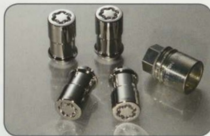
Antivol de jantes