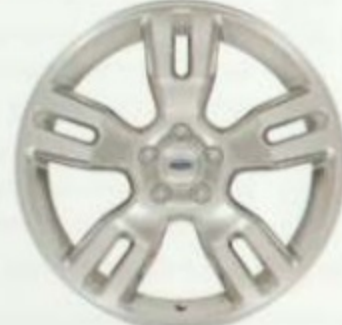
De 20 po en aluminium poli Comprises dans l'ensemble Adrenalin