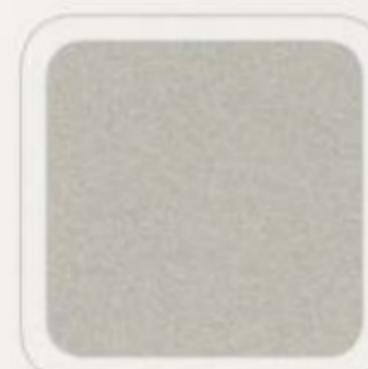
Argent brillant métallisé