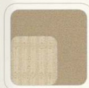
Tissu fauve avec empiecements sable De série pour XLT