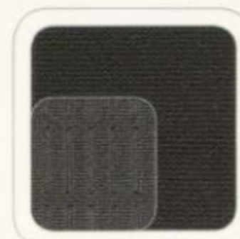
Tissu anthracite foncé De série pour XLT