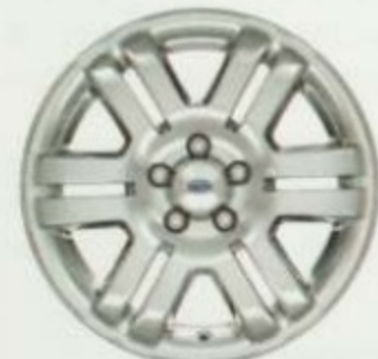
De 18 po en aluminium revêtu de chrome Comprises dans l'ensemble chromé Limited