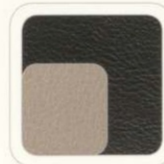
Cuir anthracite foncé avec empiecements pierre pâle moyen De série pour Limited