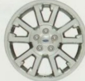
De 18 po en aluminium usiné De série pour Limited