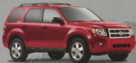
Escape et Escape hybride