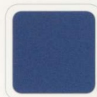
Bleu sport métallisé