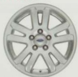
De 17 po en aluminium coulé peint De série pour XLT