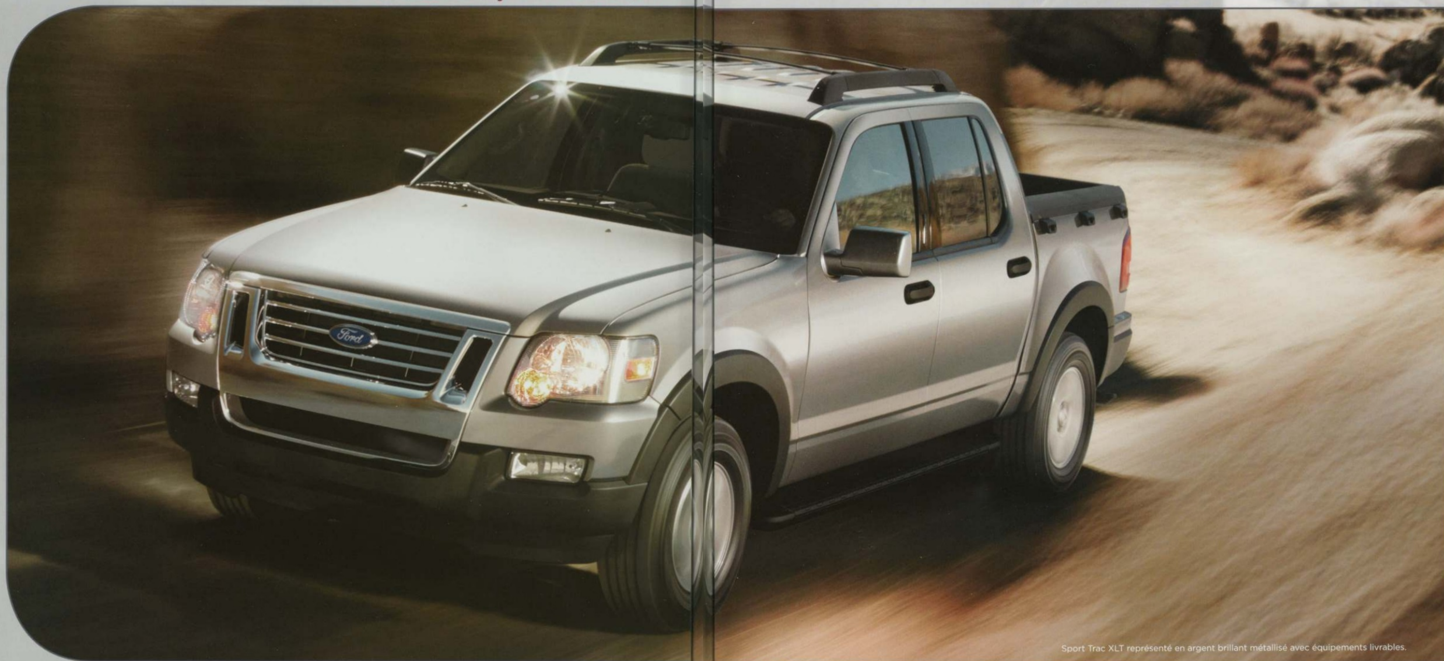
Sport Trac XLT représenté en argent brillant métallisé avec équipements livrables.

La conception unique du Sport Trac en fait le véhicule idéal pour transporter vos vélos jusqu'au sentier de randonnée ou vos motomarines jusqu'au lac. Tout ça dans le plus grand confort. Bien sûr, comme il s'agit d'un VUS Ford, il est construit pour affronter n'importe quel obstacle qui pourrait surgir devant vous.