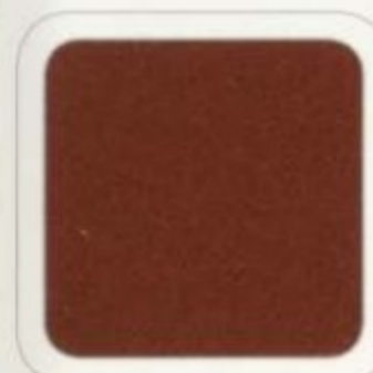
Cuivre foncé métallisé