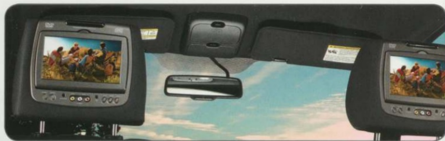
Appuie-tête à lecteur DVD INVISION® (2)

¹Accessoires Ford autorisés sous licence.