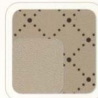
Cuir perforé en losanges gris pierre moyen pâle