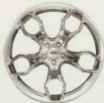
Jantes de 22 po en aluminium chromé Accessoires d'origine Ford