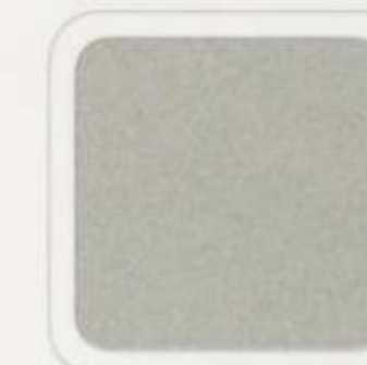
Argent brillant métallisé

Le toit suède blanc est livrable pour toutes les teintes de peinture sauf suède blanc et noir.