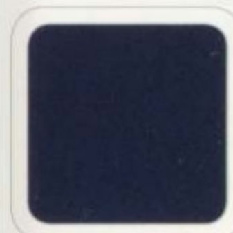
Encre bleu foncé métallisé