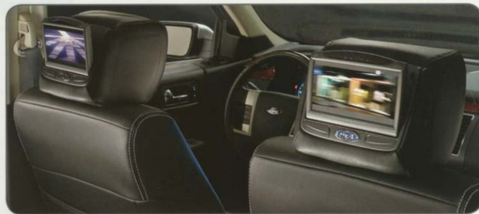
Deux appuie-tête à lecteur DVD INVISION 1