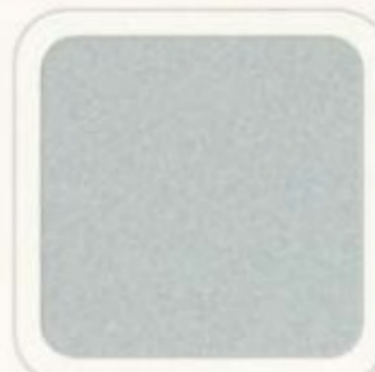
Bleu glacier pâle métallisé