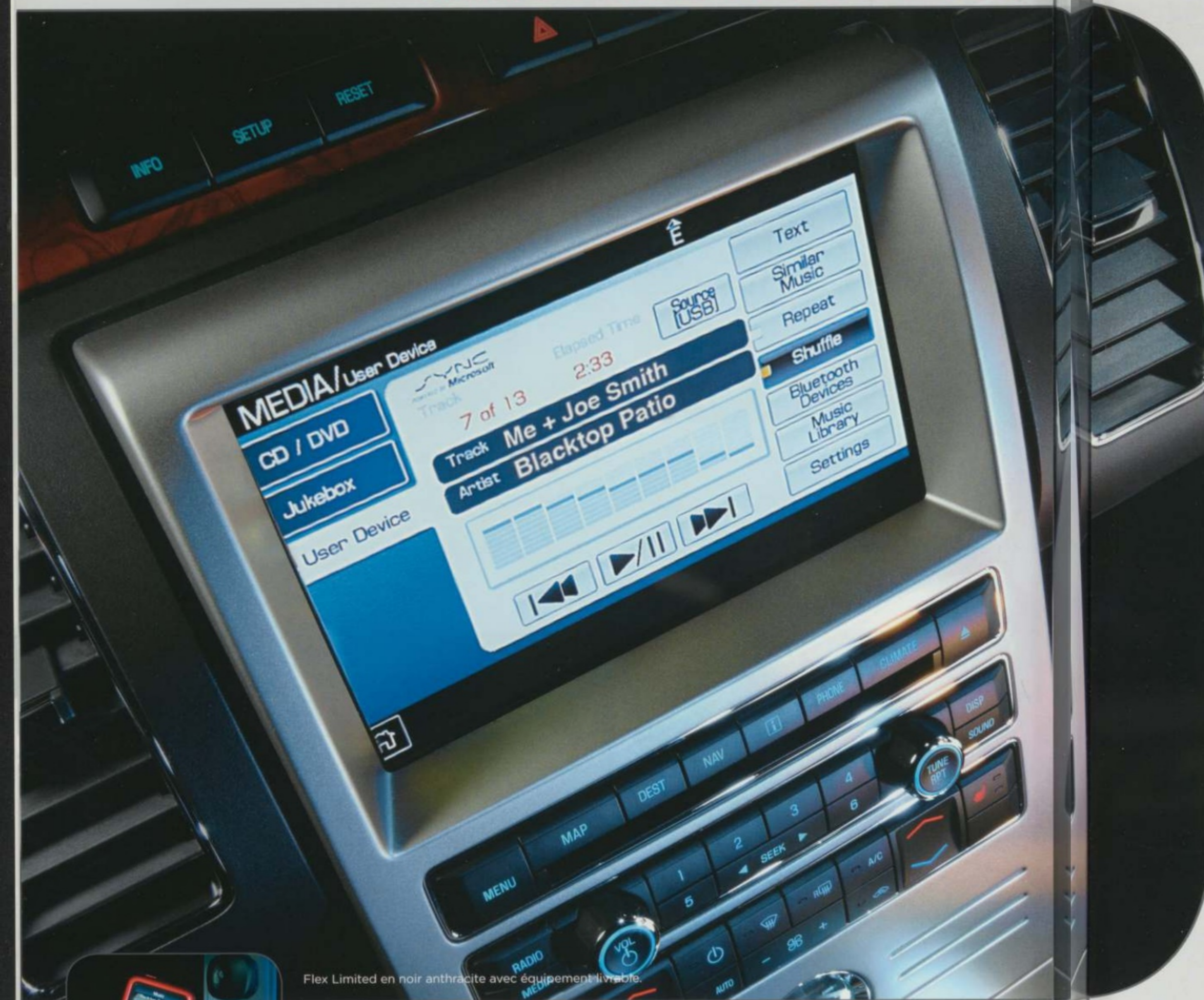
Flex Limited en noir anthracite avec équipement livrable.