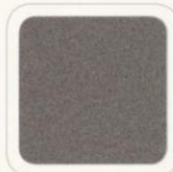
Gris sterling métallisé