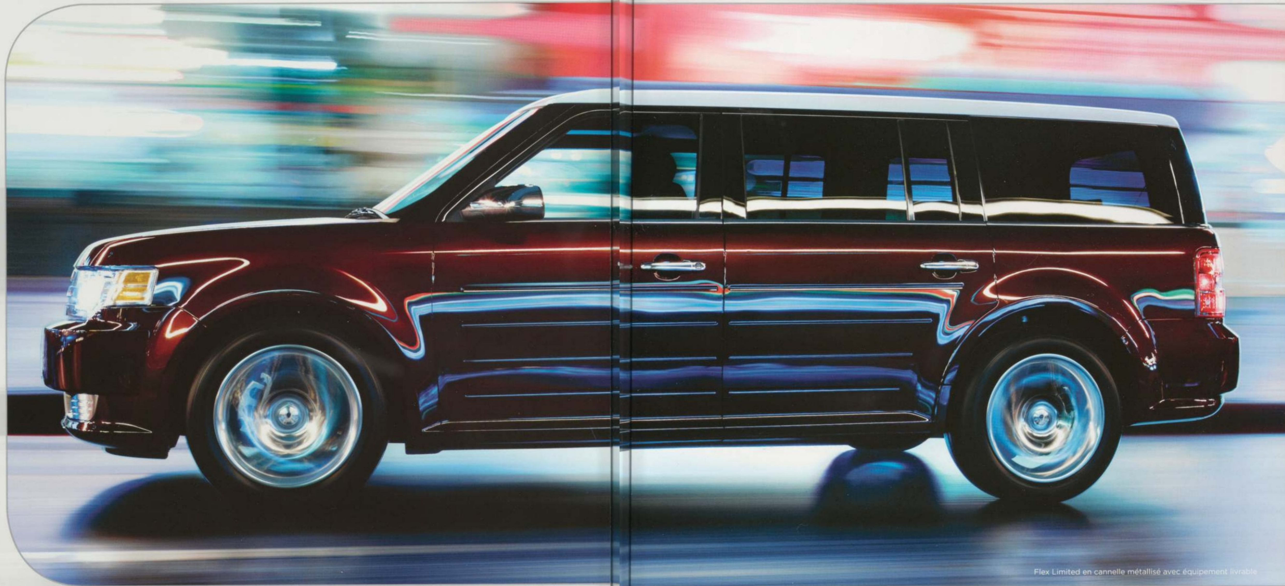
Flex Limited en cannelé métallisé avec équipement livrable

Dès le premier coup d'œil, il est clair que le tout nouveau véhicule utilitaire multsegment (VUM) Flex est tout à fait spécial. Ses lignes délicates et son design audacieux intriguent et séduisent tout en estompant la distinction entre l'élégante voiture de luxe et le VUS au caractère pratique. Le Flex est un VUM à l'avant-garde du design moderne et unique en son genre. Il n'en tient qu'à vous de choisir son côté qui vous convient le mieux.