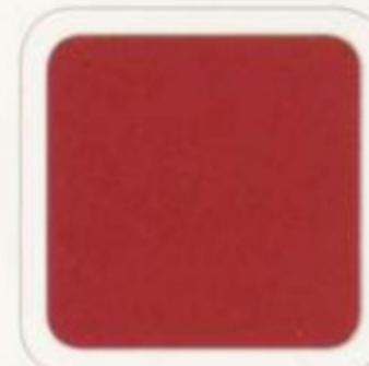
Rouge feu métallisé