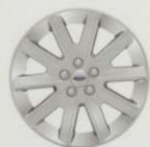
Jantes de 18 po en aluminium usiné SEL