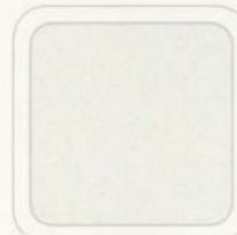
Blanc platine (trois couches) métallisé (option à coût additionnel)

Ford utilise de la peinture vernie afin d'embellir et de protéger ses véhicules. Les teintes sont illustrées à titre indicatif seulement. Toutes les teintes ne sont pas livrables pour tous les modèles. Consultez votre concessionnaire Ford Canada pour connaître les choix et combinaisons de teintes de peinture et de garniture offerts.