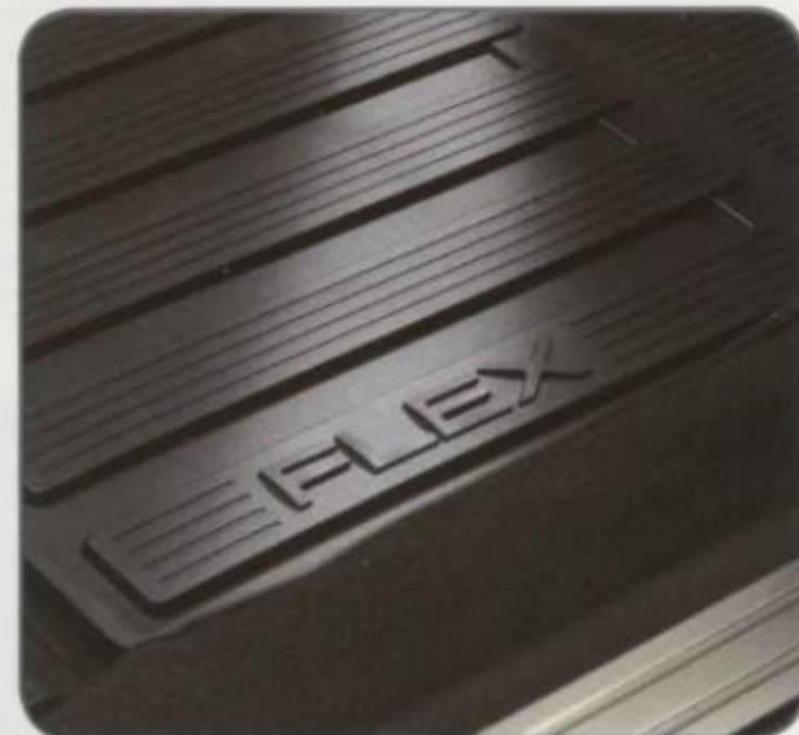
Tapis toutes saisons