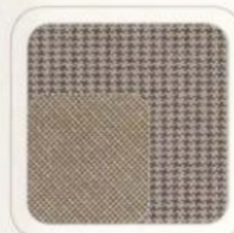
Tissu gris pierre moyen pâle