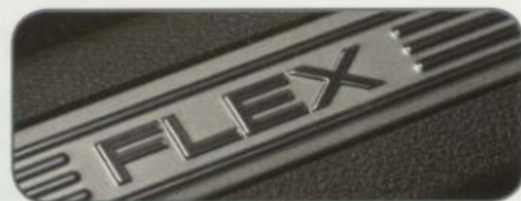
Enjoliveurs de seuil de porte avant

1 Accessoires Ford autorisés sous licence. Garmin est une marque déposée de Garmin Ltd