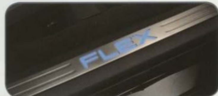
Enjoliveurs de seuil de porte avant éclairés