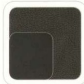
Cuir noir anthracite