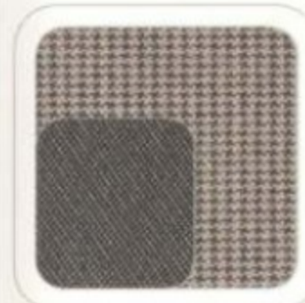
Tissu noir anthracite