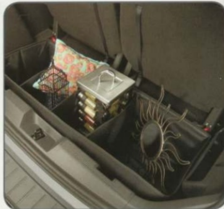
Casier de rangement intérieur 1