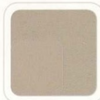
Cuir gris pierre moyen pâle