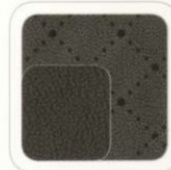
Cuir perforé en losanges noir anthracite