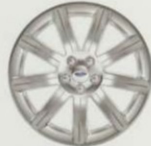
Jantes de 19 po en aluminium poli Limited