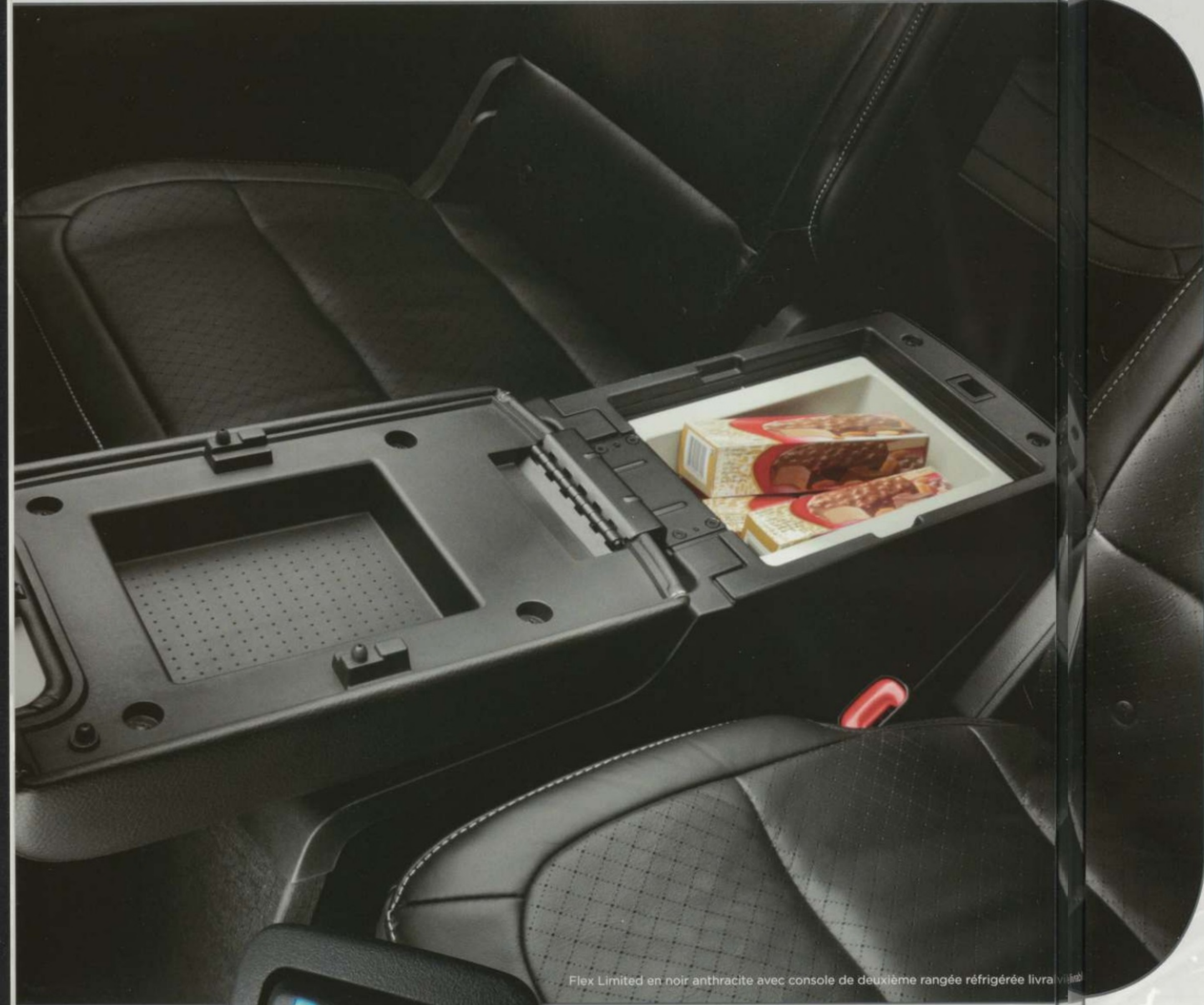
Flex Limited en noir anthracite avec console de deuxième rangée réfrigérée livrable