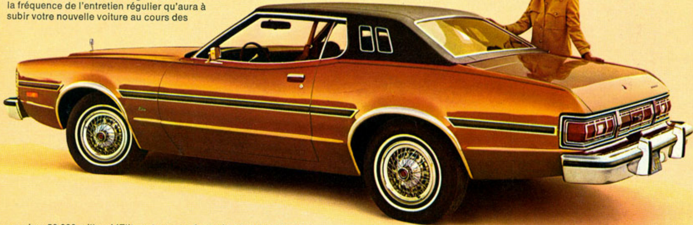
Voici l'Elite en bronze fauve métallisé (couleur 5T). Des feux arrière enveloppants, avec plaquettes réfléchissantes, rehaussent le style arrière de la voiture.

Les frais d'utilisation. Renseignez-vous sur la fréquence de l'entretien régulier qu'aura à subir votre nouvelle voiture au cours des