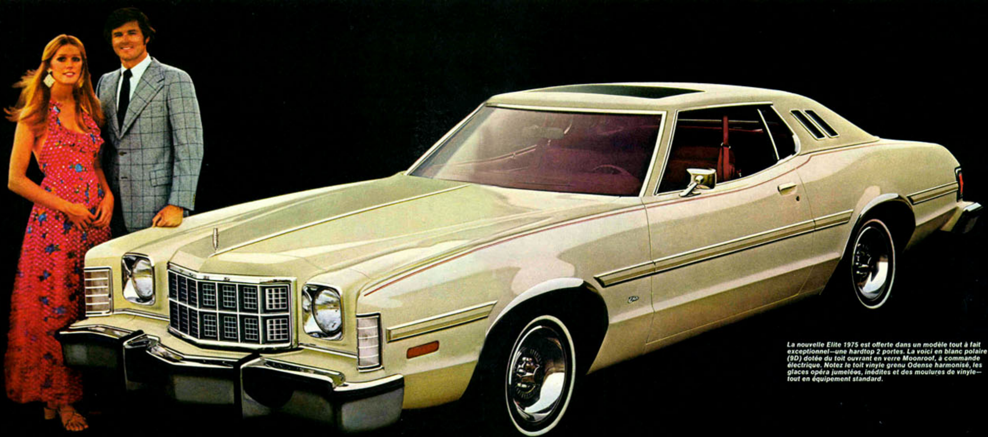
La nouvelle Elite 1975 est offerte dans un modèle tout à fait exceptionnel—une hardtop 2 portes. La voici en blanc polaire (9D) dotée du toit ouvrant en verre Moonroof, à commande électrique. Notez le toit vinyle grenu Odense harmonisé, les glaces opéra jumelées, inédites et des moulures de vinyle—tout en équipement standard.