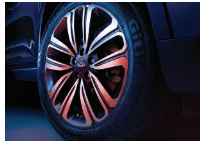
Двухцветные 18" легкосплавные диски.