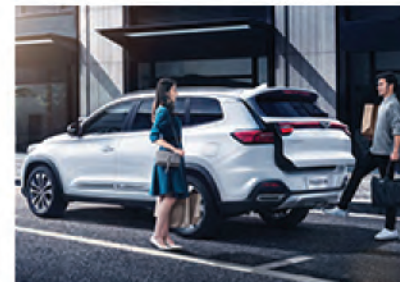
Бесконтактное открытие двери багажника.