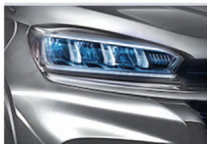
Светодиодные фары с динамическими указателями поворота.