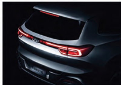
Светодиодные задние фонари матричного типа.