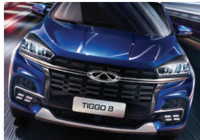
Стильная решетка радиатора.